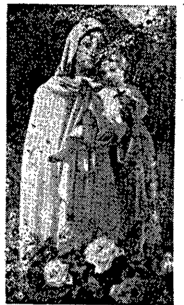
A DEFESA roga a Virgem Santíssima, ao ensejo da festa de sua Gloriosa Assunção em corpo e alma!