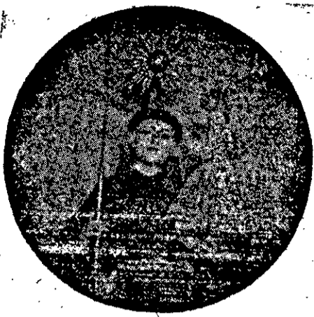
Imagem Secular de Santo Antônio, venerada na Matriz de Neópolis

Várias cidades e numerosos povoados da diocese se preparam para homenagear Santo Antônio, no dia 13 de junho - Em Neópolis prometem ser extraordinárias as solenidades - Em Propriá, os festejos terão o tradicional brilhantismo, com a participação de todas as classes sociais