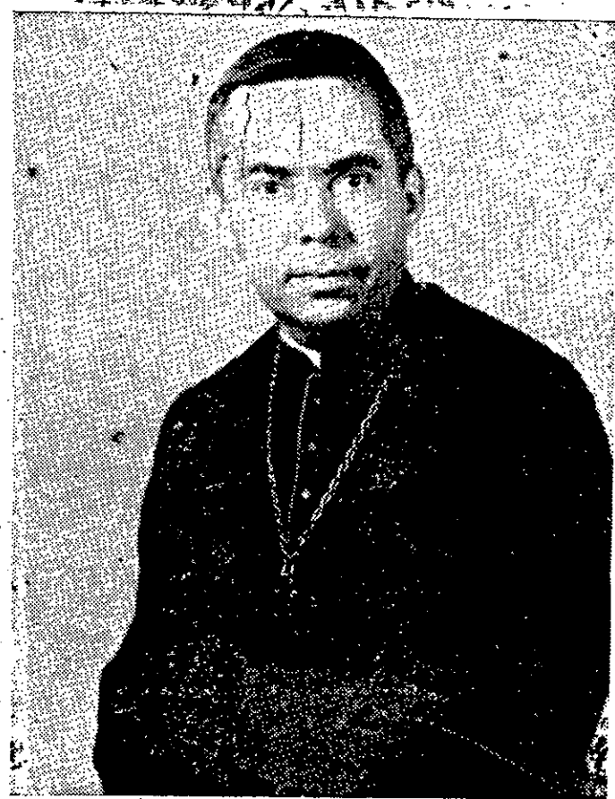
Segunda-feira dia 13 se deu a passagem do primeiro aniversário de posse do segundo arcebispo de Aracaju Dom Luciano José Cabral Duarte. Váris homenagens foram prestadas culminando com uma solene missa concelebrada na Catedral Metropolitana com a presença das autoridades e do povo em geral.