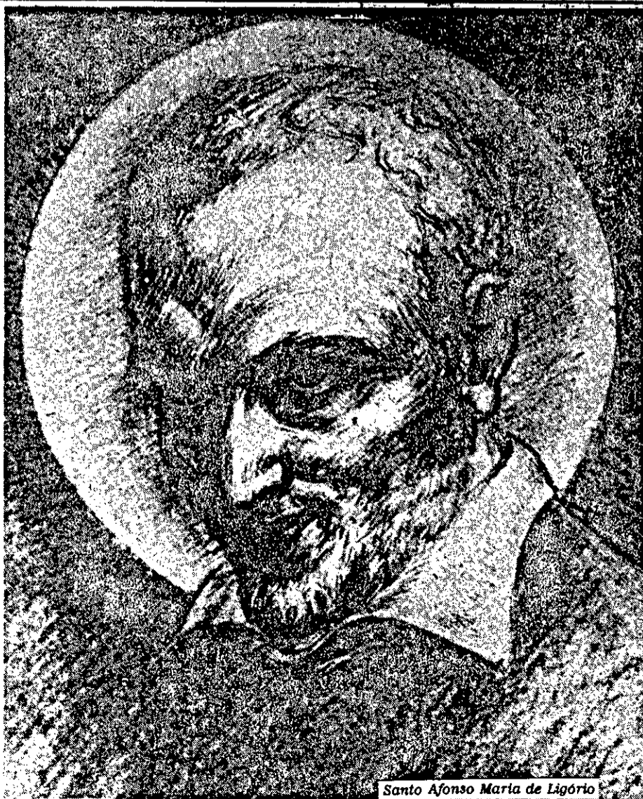
Santo Afonso Maria de Ligório

Foi, no mesmo tempo, um escritor brilhante e apreciado. Seus livros se tornaram famosos. Suas ideias fizeram escola. Esta é a razão pela qual, no fim do século passado, a Igreja o proclamou "DOUTOR DA IGREJA", um título que, por si só, fala do valor de seus escritos. (Continuação na última pag.)