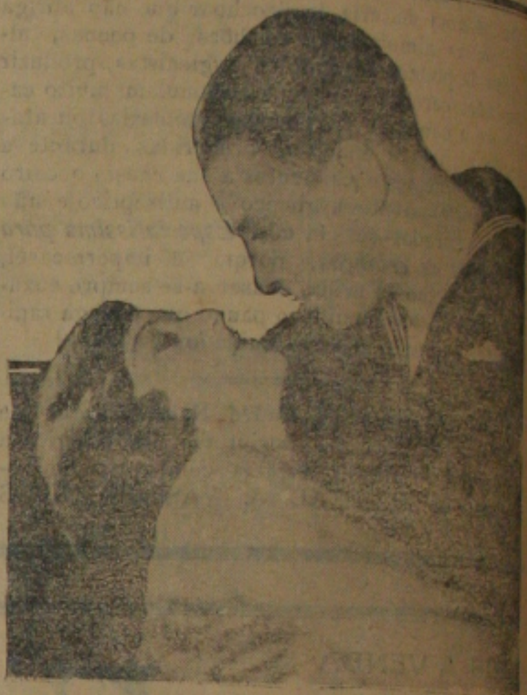
Uma scena do film "Os Bombeiros"