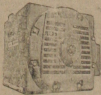
Motor CUSTOM "8.000" G-E

Para sua oficina ou fábrica, para acionar máquinas de sua produção!