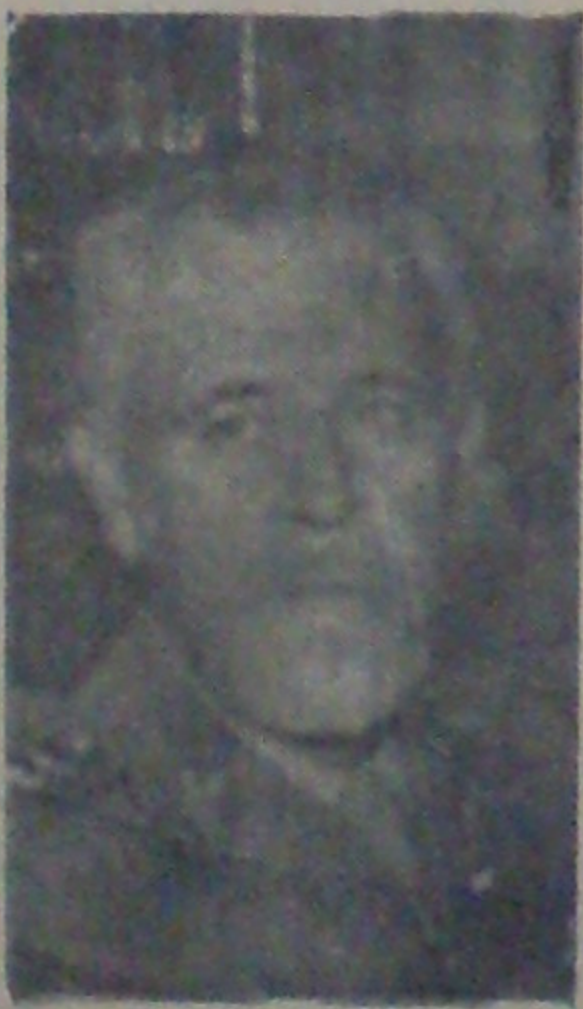
Col. Lopes Bragança

Coronel Lopes Bragança foi nomeado no comando do 28.º Batalhão de Caçadores do Estado de Minas Gerais, e da guarnição de São João del Rey, onde comandou o 28.º Batalhão de Caçadores.