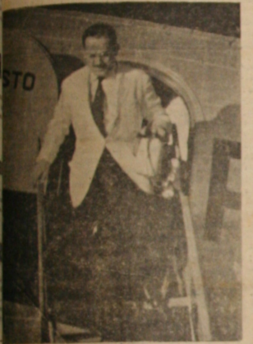
Deputado Euvaldo Diniz

Em sensacionais declarações a reportagem de "GAZETA DE SERGIPE", momentos depois de desembarcar nesta Capital, ontem à noite, afirmou o Deputado Euvaldo Diniz: "Sou candidato a Governador do Estado, e estou chegando a Sergipe para fazer ciente aos meus amigos dessa decisão"