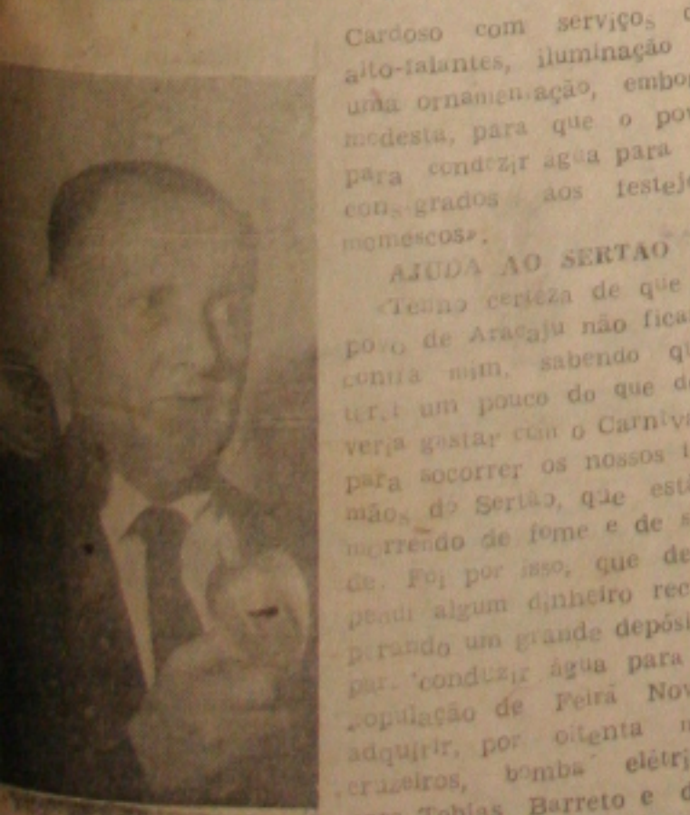
Entretanto, acrescentou Prefeito, fiz o que pude. Preparei a Praça Fausto

A Secretaria de Segurança tomou providências para a manutenção da ordem durante os dias de Carnaval determinando o policiamento ostensivo pelas ruas da cidade, nos bares, clubes, cassinos e boates.