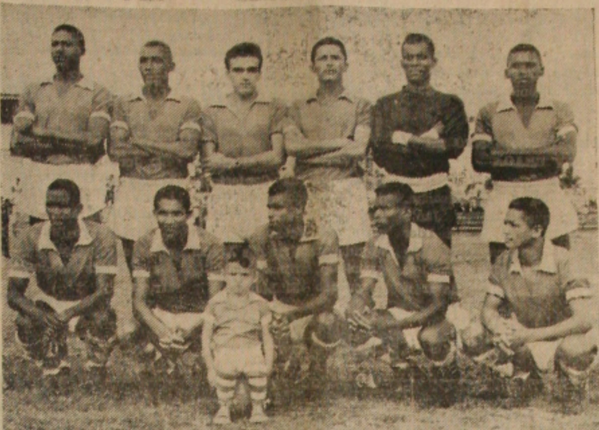
Quadro do Sergipe, que com algumas modificações brilhou na Bahia

MOVIMENTO TÉCNICO Jogo — Bahia x Sergipe Local — Estádio Othoniel Dorea Mangabeira (Bahia) x Sergipe (Bahia) Renda — Crs 350.000,00 Juiz — Dan e Correia 1º Tempo — Bahia 2 x 1 (Alencar aos 7 minutos) 2º Tempo — Bahia 2 x 1 (Thomas aos 24 minutos) Biriba aos 32 minutos Final — Bahia 2 x Sergipe 1