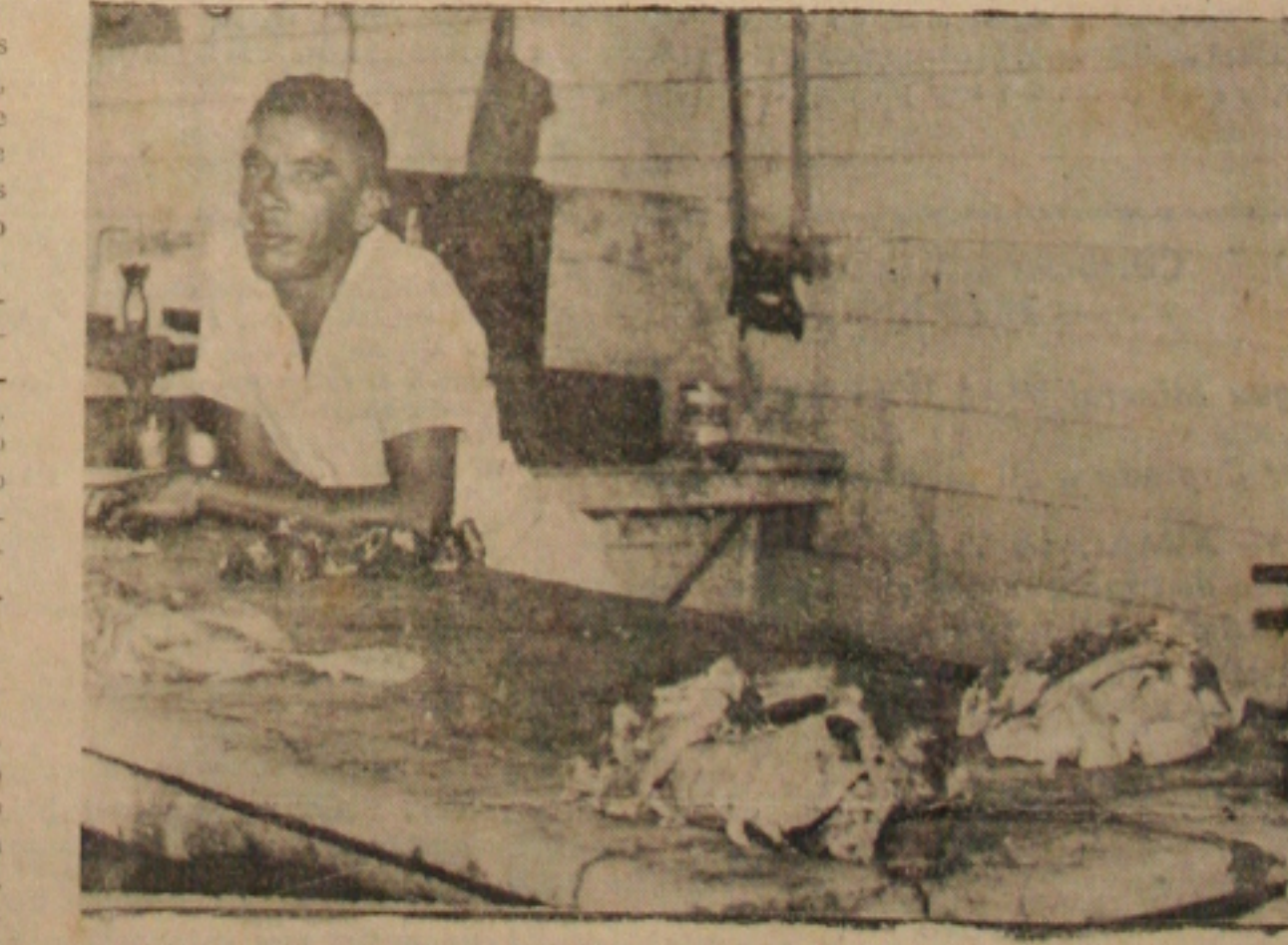
A carne para o aracajuano é uma só e agora pelo mesmo preço

Um fato relacionado com a isenção de impostos para o Frigorífico, como indústria pioneira, confirma os aspectos dessa luta. A empresa, na época oportuna, requereu a isenção dos tributos estaduais, porém para gozar do favor fiscal, quando do deferimento do pedido,