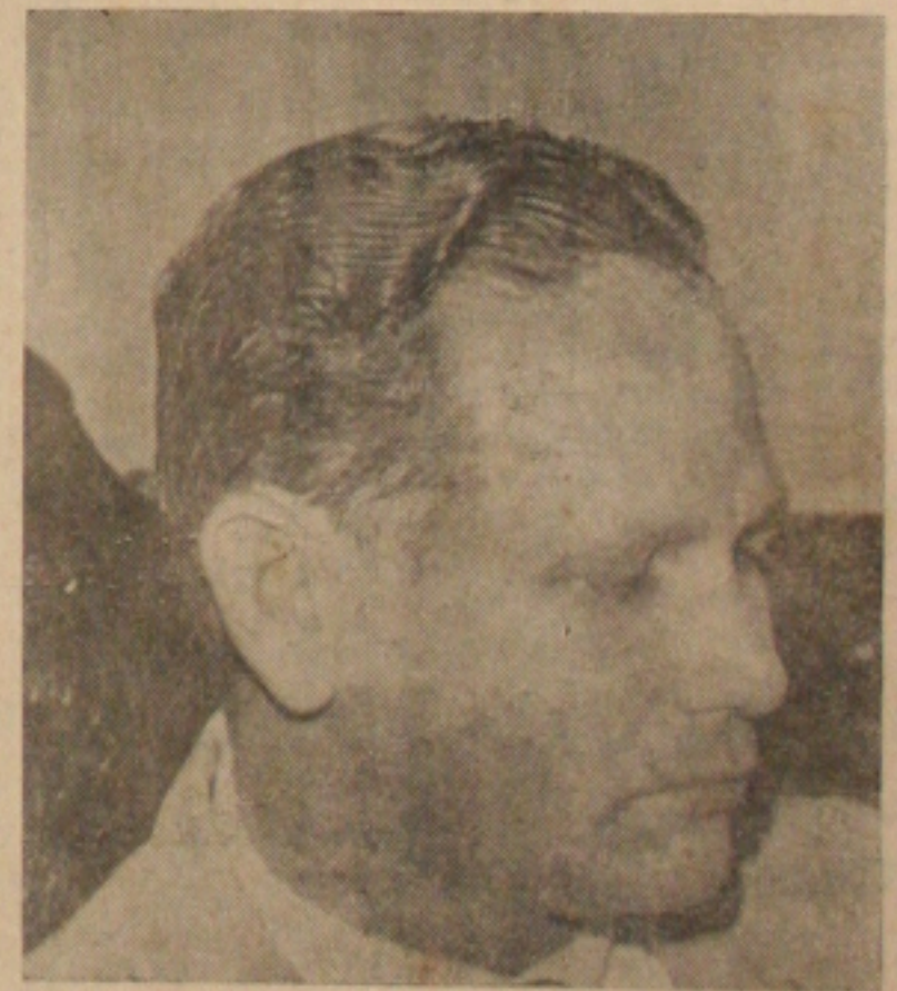
Deputado Seixas Dória

Entre outros oradores, deverão falar em Barra dos Coqueiros, o Deputado Seixas Dória, o Prefeito Conrado de Araujo, o Deputado Leite Neto e o jornalista Orlando Damascos, Diretor