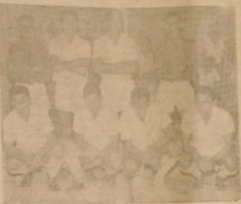
IATE - Candidato sério a conquista da 1.ª COPA.

cs de sensação que foram verificados. Na realidade foi um encontro de alto gabarito e que veio premiar os dois clubes, que terminaram a primeira etapa com o marcador registrando um empate em branco, muito embora a pioneira estivesse mais perto de inaugurar a contagem.