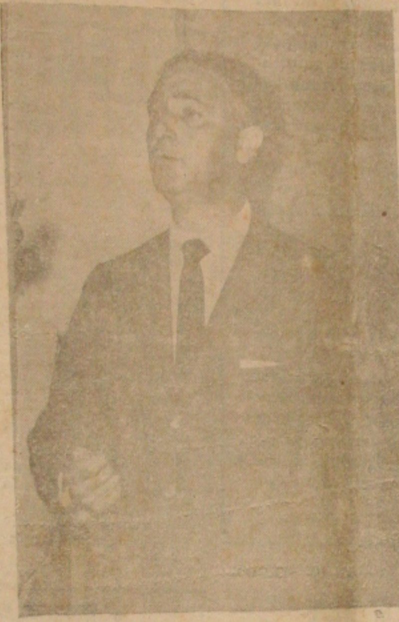
Ministro Franco Montoro quando falava com os trabalhadores.

Conforme vinham, notando-se a importância da chuva para a população local, que vinha sofrendo horivelmente com a séca devastadora.