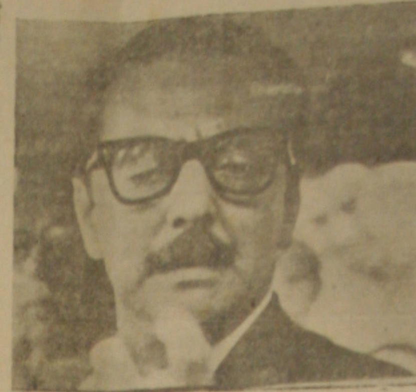
Ex-Presidente João Quadros

A empresa assegura completa assistência técnica no tocante aos teares de