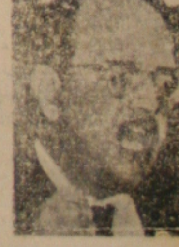
Chanceler Santiago Dantas

O Chanceler brasileiro insistiu em que seja concluído imediatamente, um acordo sobre a suspensão dos testes nucleares tanto atmosféricos, como submarinos, e subterrâneos, continuando os técnicos a se reunir para estudar os meios de controle mais eficazes para esses últimos.