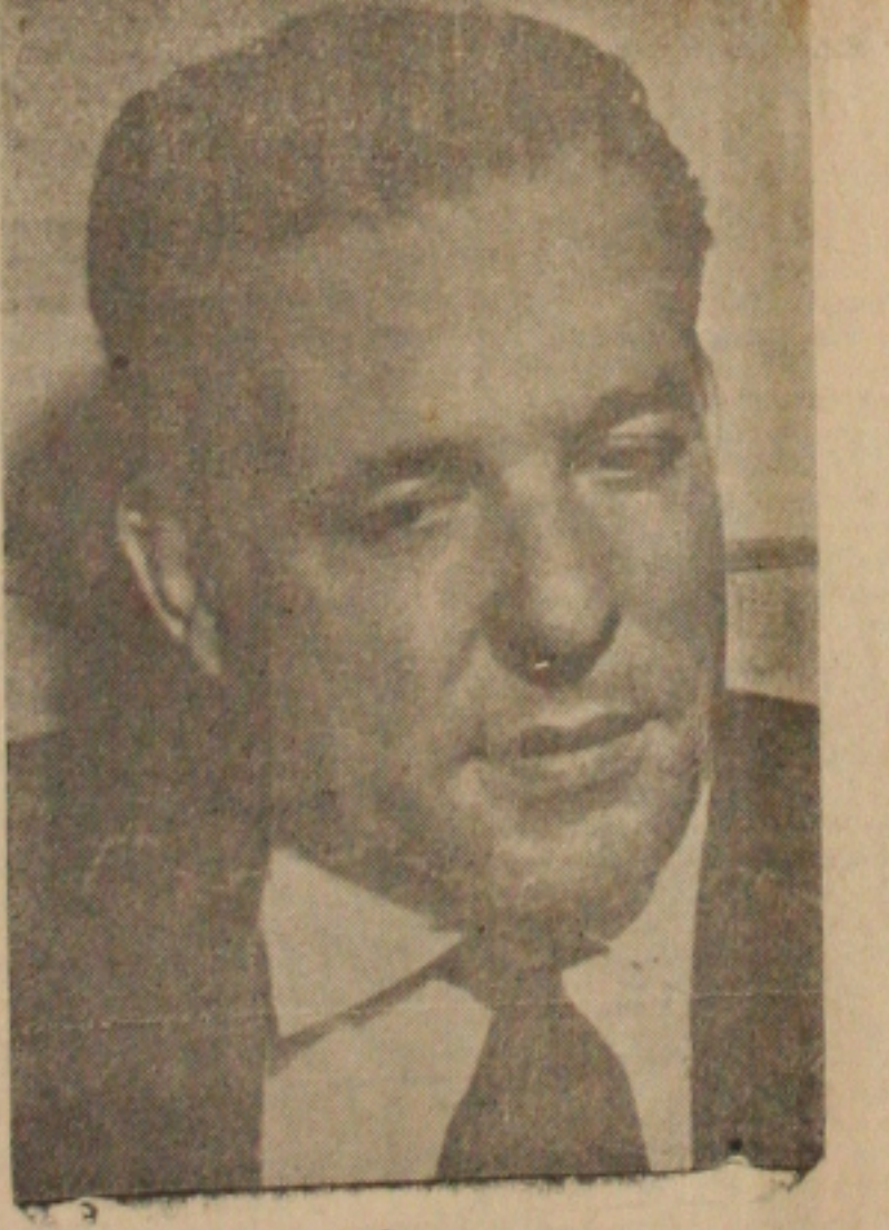
Presidente João Goulart

Em sinal de protesto ao Ato do senhor Ranieri Mazzili, todos os membros do gabinete militar se consideraram demissionários.