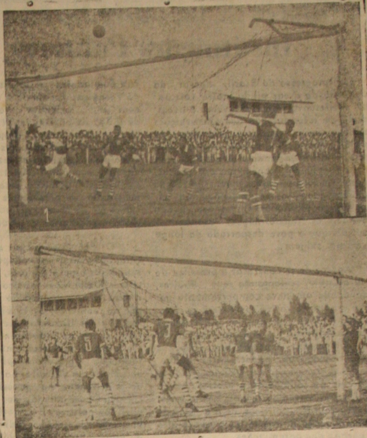
Dois flagrantes do jogo C.S. Sergipe e Santa Cruz, no último domingo no Estádio de Aracaju: (1) um dos impetuosos ataques da ofensiva do Sergipe; (2) Lance que redundou no gol da vitória do "Derrubador de Campeões". (Detalhes do importante prélio na 5ª página desta edição)