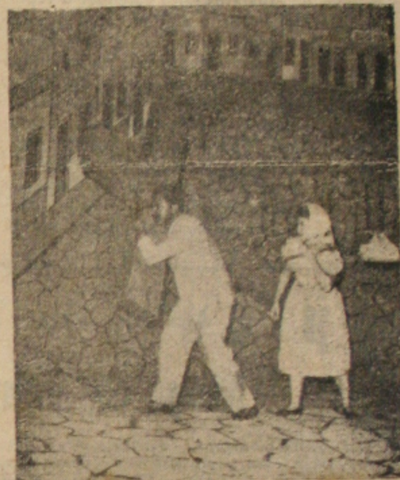
Cena de «O Pagador de Promessas»

A Sociedade de Cultura Artística de Sergipe estará apresentando amanhã, a partir das vinte horas e trinta minutos, no Auditório do Colégio Estadual de Sergipe, o Teatro de Estudantes da Paraíba, que levará à cena a peça de Dias Gomes, «O Pagador de Promessas».