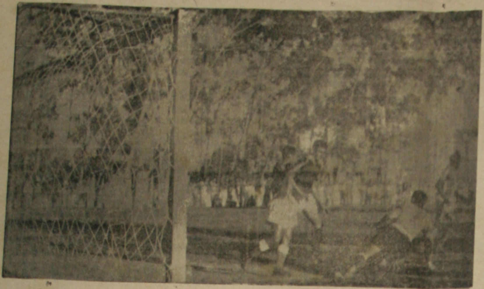
Lance do Jôo Espor do Recife X. Confiança no Estádio Proletário ontem à tarde

Em peleja que apresentou índice de futebol dos mais fracos, Confiança e Esporte Clube do Recife empataram por dois tentos a dois no jôgo que marcou a estréia do conjunto pernambucano em nossos gramados.