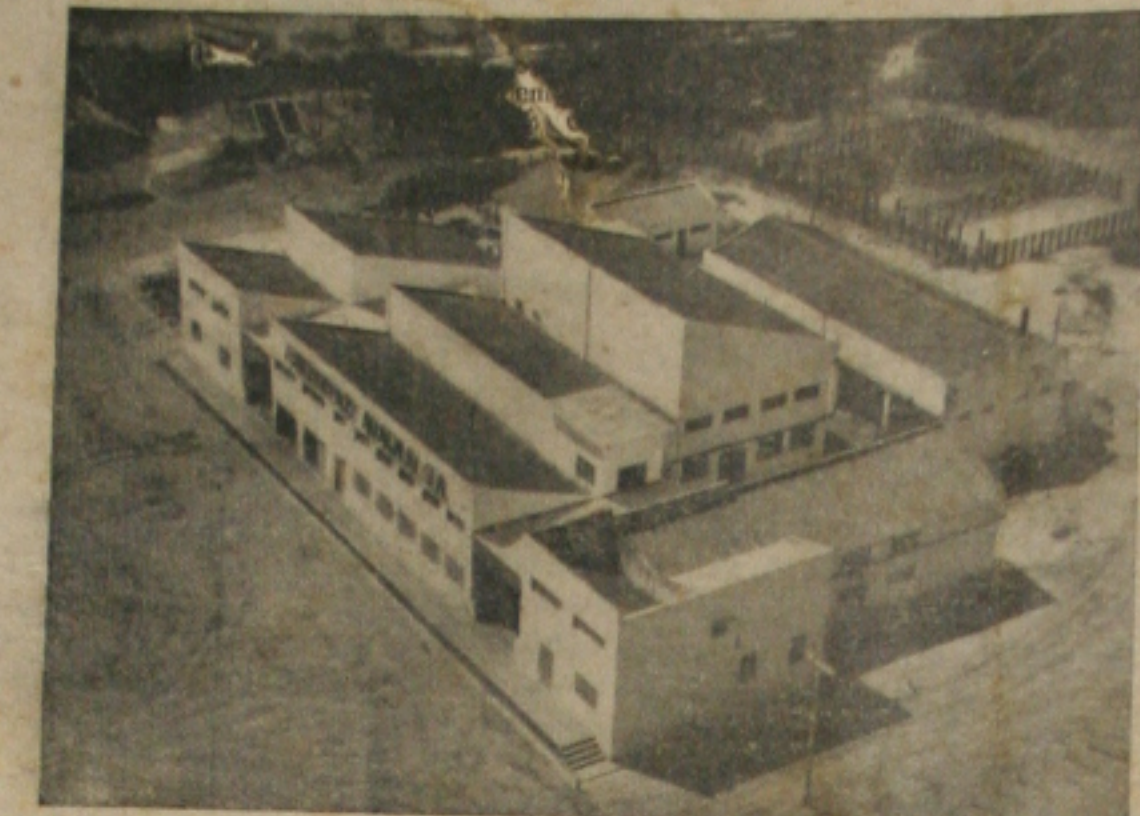
O MERCADO E OS PREÇOS

Por seu turno, dizem os partidários da candidatura Miguel Arrais que a reforma agrícola e outras medidas de caráter social só serão conseguidas para o povo da região com a substituição total de seus governantes.