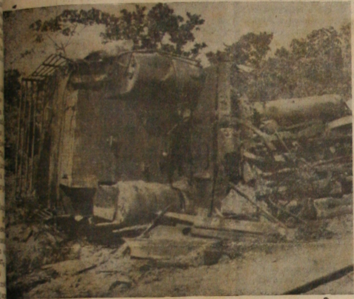
Estado em que ficou a locomotiva