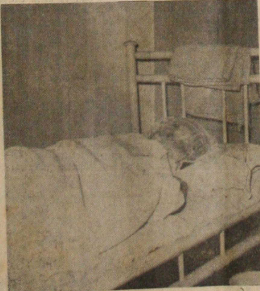
O Rato da mulher irreconhecível