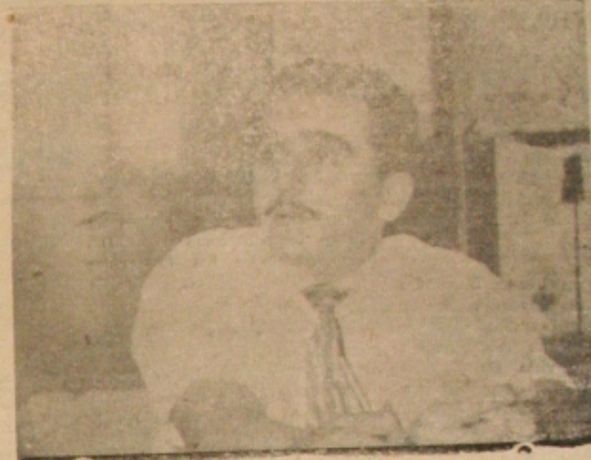
O Presidente da Confiança, cuja diretoria puniu coletivamente aos jogadores que atuaram domingo.