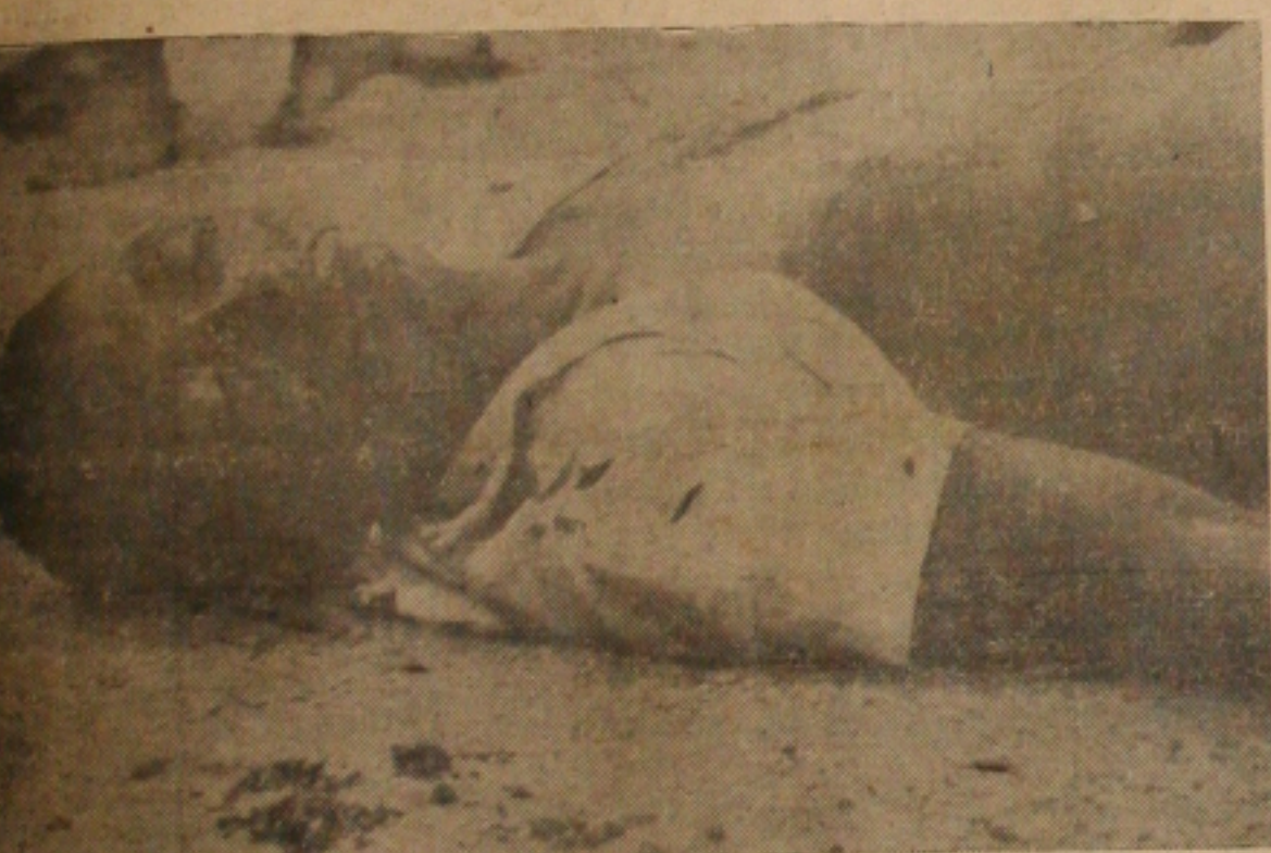
Gineu morto, defesa do lar ou disputa?