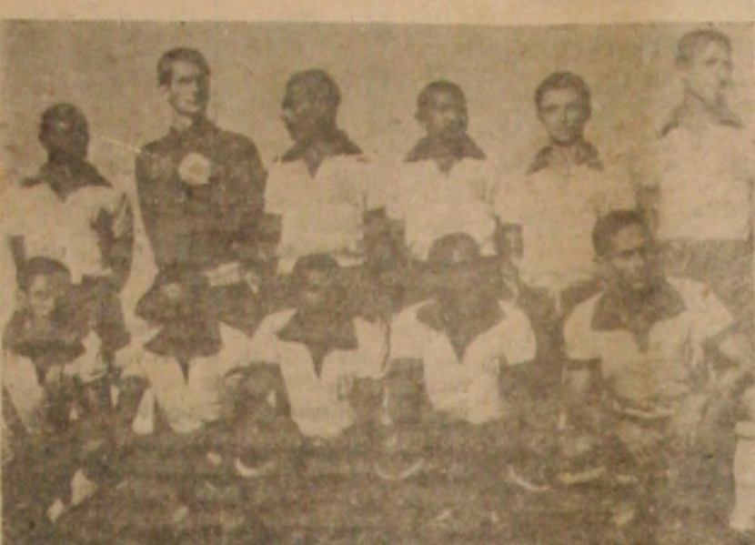
OS MULTADOS — E a equipe do Confiança multada, coletivamente pela direção do grêmio operário, em virtude de alguns e individualismo da