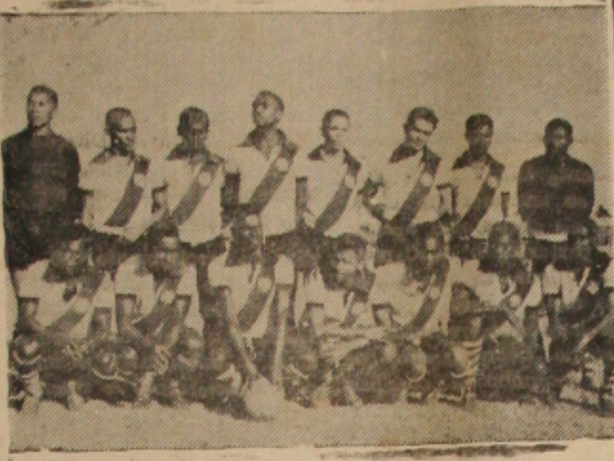
A EQUIPE VASCAINA que domingo estará enfrentando ao campeão estadual em interessante amistoso no Estádio da zona sul da Cidade.

gular coincidência pelo mesmo escorê de dois tentos. Isto entretanto não servirá para diminuir o interesse do público esportivo, que reconhece nas duas equipes, principalmente a campeã, dois bons quadros.