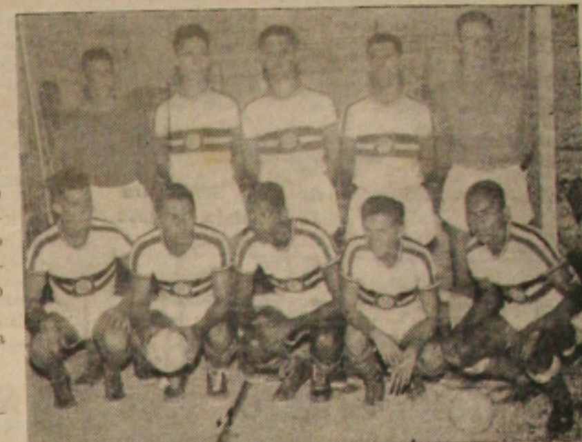
A PIONEIRA EM AÇÃO — A Associação Atlética de S'r- gipe, pioneira do esporte sa- lonista em Sergipe, que en- frentará ao BNB na terceira partida da primeira parte do torneio início programada para sábado em sua quadra.