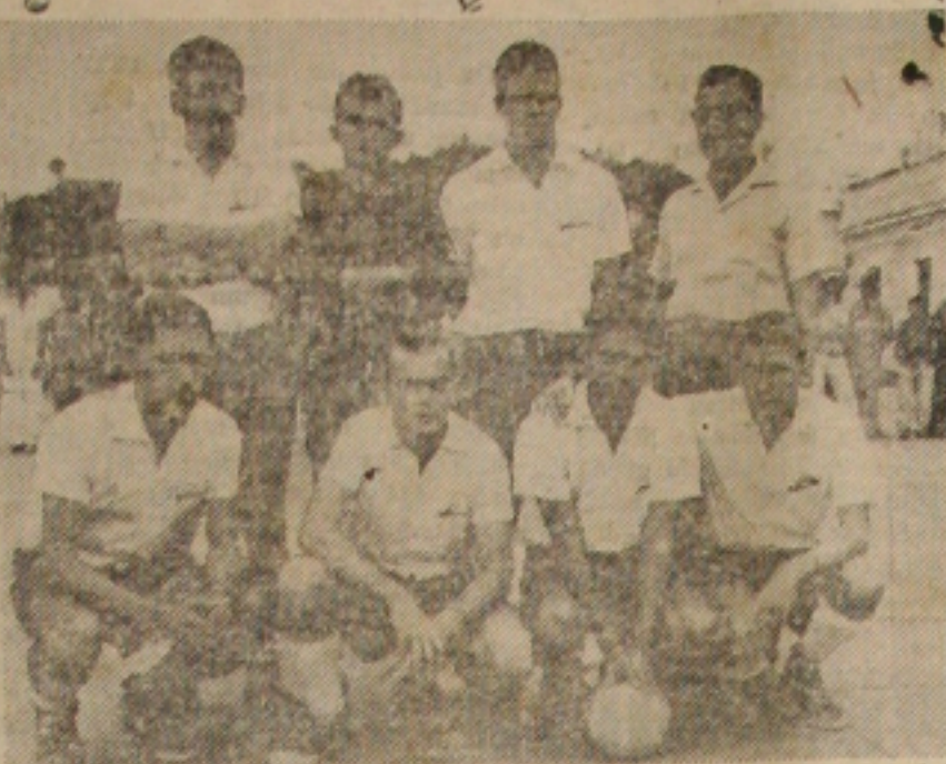
O IATE CLUBE DE ARACAJU, considerado o maior qua- dro salonístico sergipano que sábado estará participando do torneio início de 1962, enfrentando ao Olimpico na quarta peleja da noite.

Vários troféus foram ofe- recidos por casas comerciais da nossa Capital, destinados aos clubes campeões do tor- neio e do desfile, bem como ao atleta que venha a se constituir em artilheiro da competição. Ao campeão do torneio caberá a «Taça Casa Maringá», ao vencedor do desfile a «Taça João Mascarenhas Neto» e finalmen- te ao jogador que marcar o