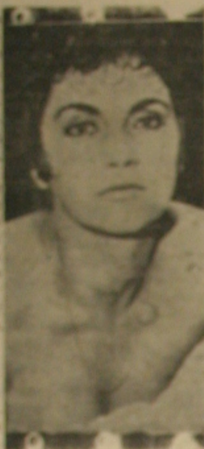
... e a mulher...