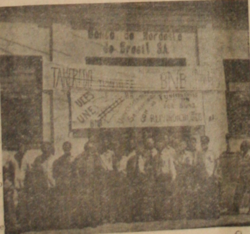
Funcionários do BNB em piquete

Apesar da greve dos servidores do Banco do Nordeste do Brasil S/A, que contou com muitas manifestações das referidas entidades.