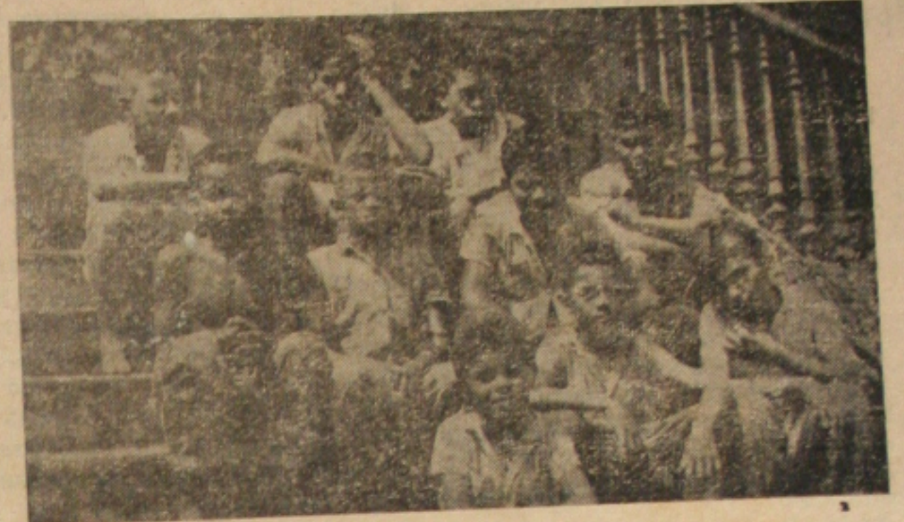
Quadrilha de pivetes. Seu comandante é o menorzinho

Em conversa com a nossa reportagem o comandante da quadrilha mirim disse que a lei é seca no seu bando, e o que se arriscar de desrespeitar uma ordem sua, terá uma orelha cortada.