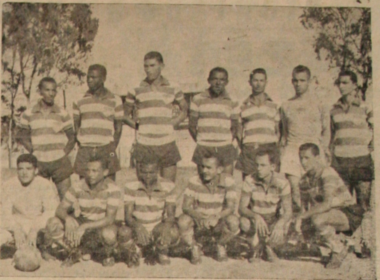
O PIVOT DA QUESTÃO—O quadro do Esporte Clube Propriá, incidindo do rumo do caso que vem se arrastando pelos tribunais esportivos, de onde ter o seu desfecho logo mais a partir das dezoito horas, na sede da CBD.