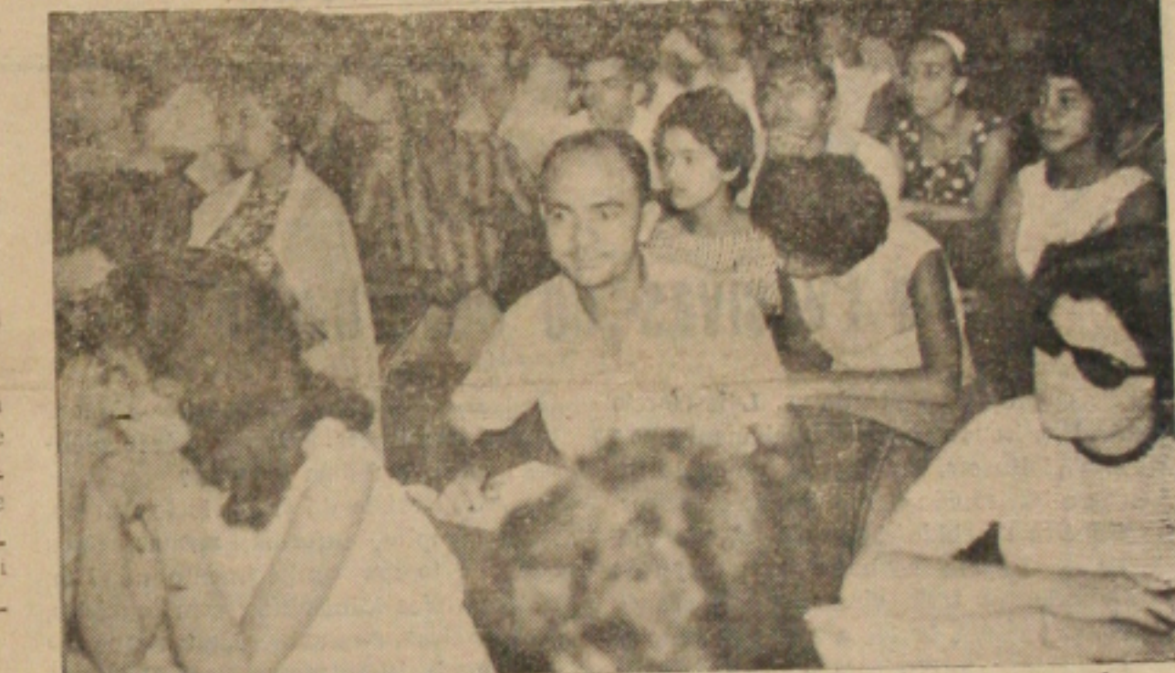
Aspecto do Seminário de Reforma Universitária

Consultado sobre o tema de CAMINHO DA SOLI-