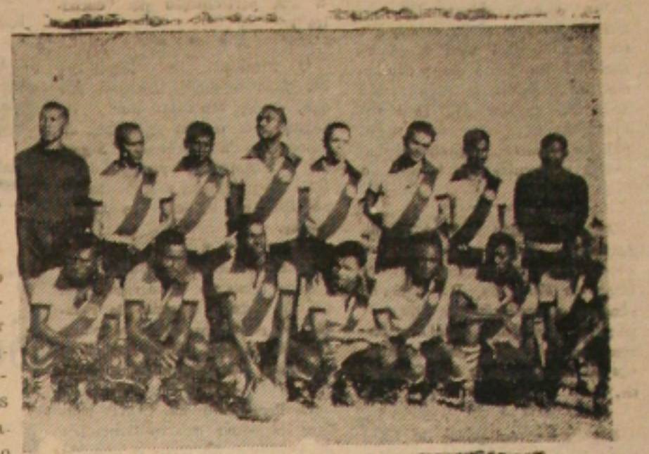
VASCO AJUSTA LINHAS E TENTA REABILITAÇÃO — Vasco estará logo mais enfrentando amistosamente ao Sergipe em jogo que servirá para a acríca de linhas e de entrega dos pontos pelo clã-tentativa de reabilitação da derrota frente ao Olímpico por dois a um.

A partida conforme anunciamos ontem, terá como mediador ao sr. Pedro Souza, que será auxiliado por João Gomes e Alberico Santos. Na preliminar, os juvenis de ambos os quadros estarão preliando amistosamente em substituição ao cotejo Madureira x Flamengo, anteriormente programado pelo certame de amadores e cancelado em virtude de entrega dos pontos pelo clã-tentativa de reabilitação da derrota frente ao Olímpico por dois a um.