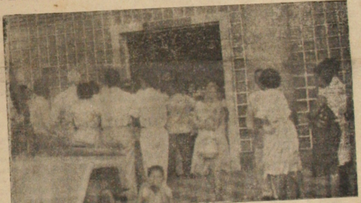
«Fila do Vale» no Walter Franco