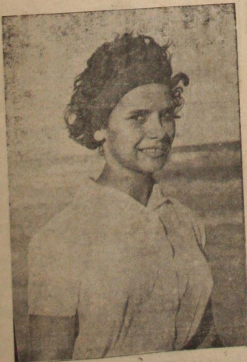
Gedalva, na praia

Não, ela não é candidata a Rainha do Milho porque, embora estude na terceira série do Curso Científico, é aluna do Colégio Tobias Barreto.