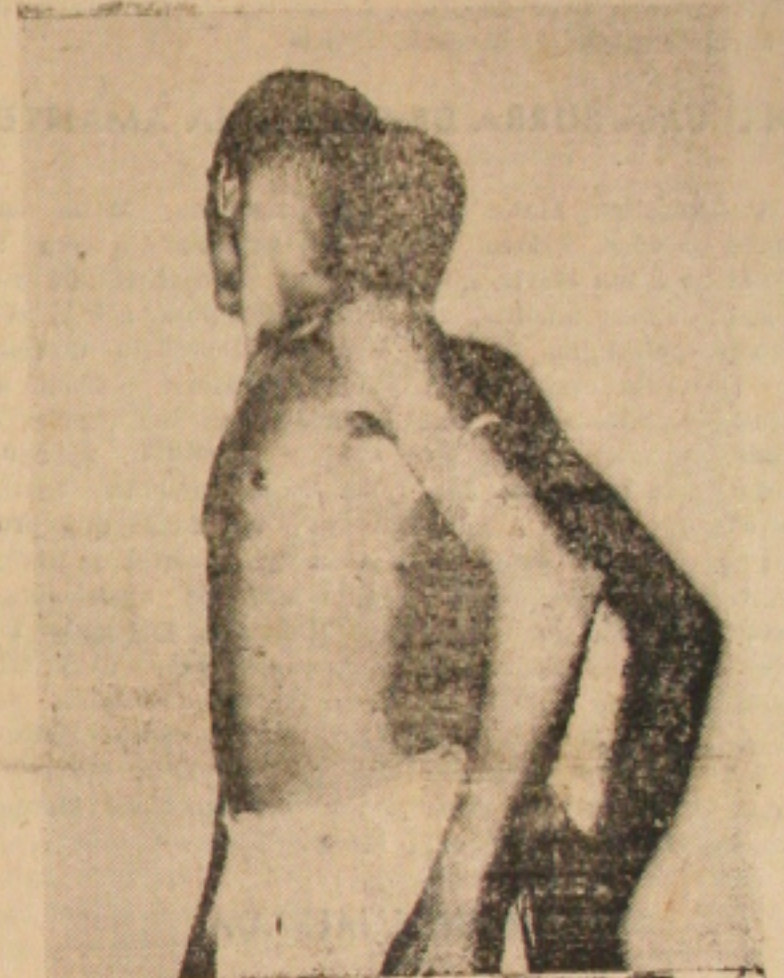
— A UDN se reúne hoje em Assembléia Geral. Dali surgirá o nome da próxima vítima...