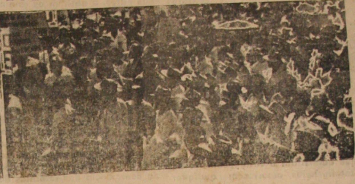
Flagrantes da visita de Jango à Paraíba

são dos papéis: em termos de quem tinha terra passará a ser camponês e este passará as terras. Minha reforma agrária atende aos princípios cristãos e democráticos como almeja o povo brasileiro. Defende uma reforma brasileira. A experiência da Rússia ou da China pode ter sido boa para os russos e chineses. Mas o Brasil precisa de uma reforma agrária brasileira. Que dê ao camponês outros direitos, pois o único direito que ele possui é o de substituir e como