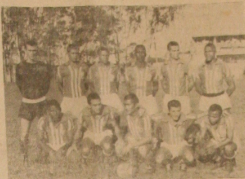
PERDEU MAS AINDA É LÍDER — Mesmo perdendo, o Confiança continua líder do atual certame, só que agora tem o Paulistano como companhia.