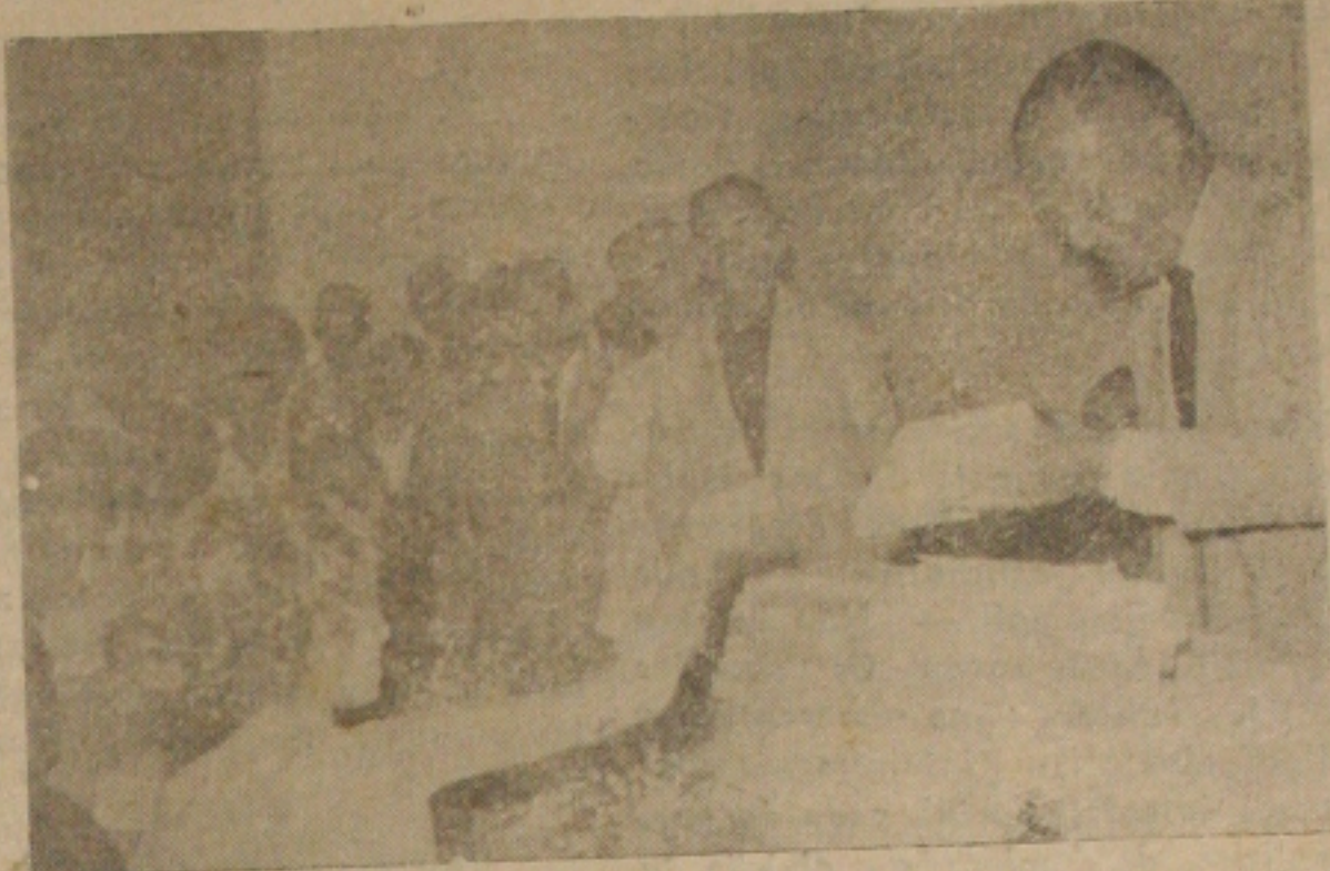
Aspecto da festa de relançamento de "Minha Gente" em na Biblioteca "Clodomir Silva"

Como foi amplamente anunciada, realizou-se, ontem, no salão Siqueira Campos, a cerimônia de lançamento da edição da reedição do livro "Minha Gente", do escritor sergipano Clodomir Silva. A obra, editada pela Prefeitura Municipal. Na oportunidade compareceram altas autoridades e intelectuais do nosso Estado, e grande número de pessoas amigas e admiradoras da obra do escritor Clodomir Silva. Na oportunidade foram apresentados no salão da Biblioteca "Clodomir Silva" os retratos de Graco Cardoso e Conrado de Araújo, tendo falado, em nome da família do primel- ro, o poeta Clodaldo de A-