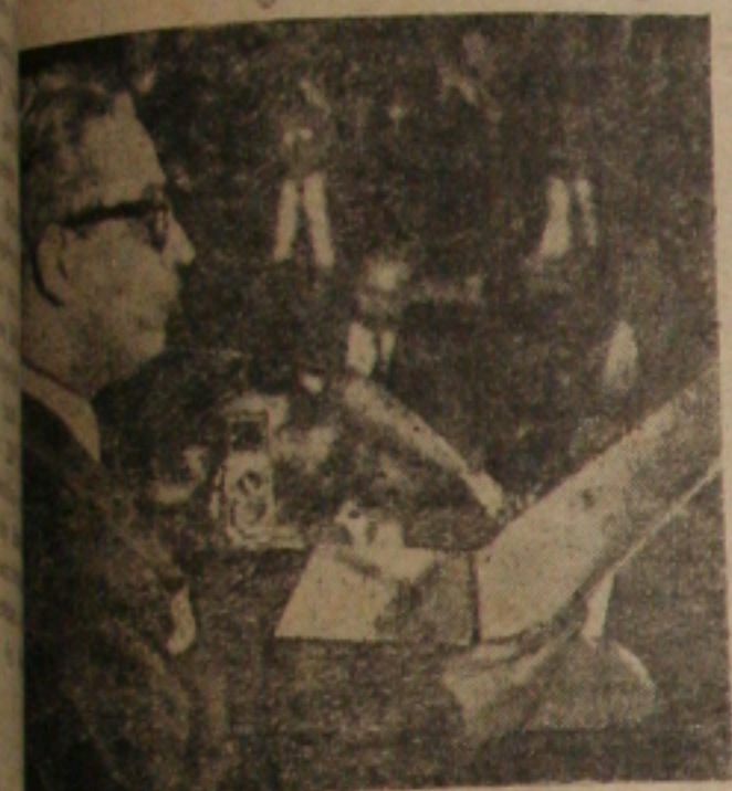
Premier Brochado da Rocha

CONFIAIS FONTOS DA MENSAGEM DO CONSELHO DE MINISTROS — BROCHADA ANTE OS DEPUTADOS TERÇA-FEIRA BRASILIA, 10 — Urgente — Foi encaminhada hoje a tarde à Câmara dos Deputados, a Delegação de Poderes, devendo o serchado da Rocha comparecer à Câmara para defender a referida mensagem.