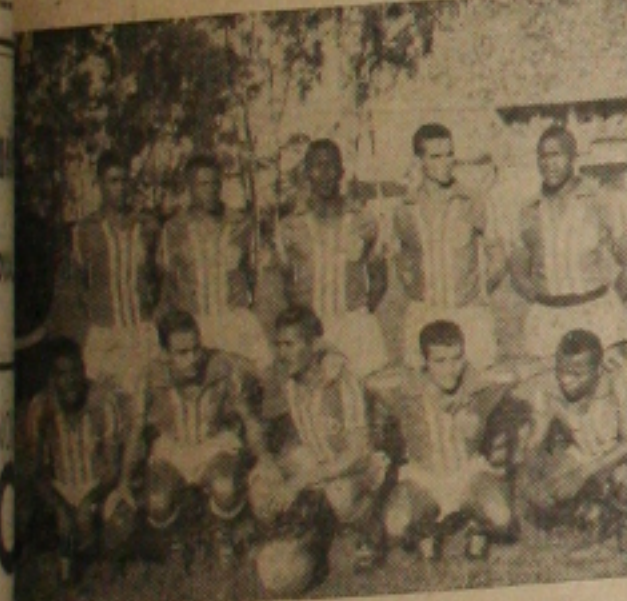
FIANÇA ABAIXO DA CRITICA — O quadro do Confiança que estreou de forma decepcionante em Maceió, chance de reabilitação na 2ª e última peleja, programa para 4ª feira.