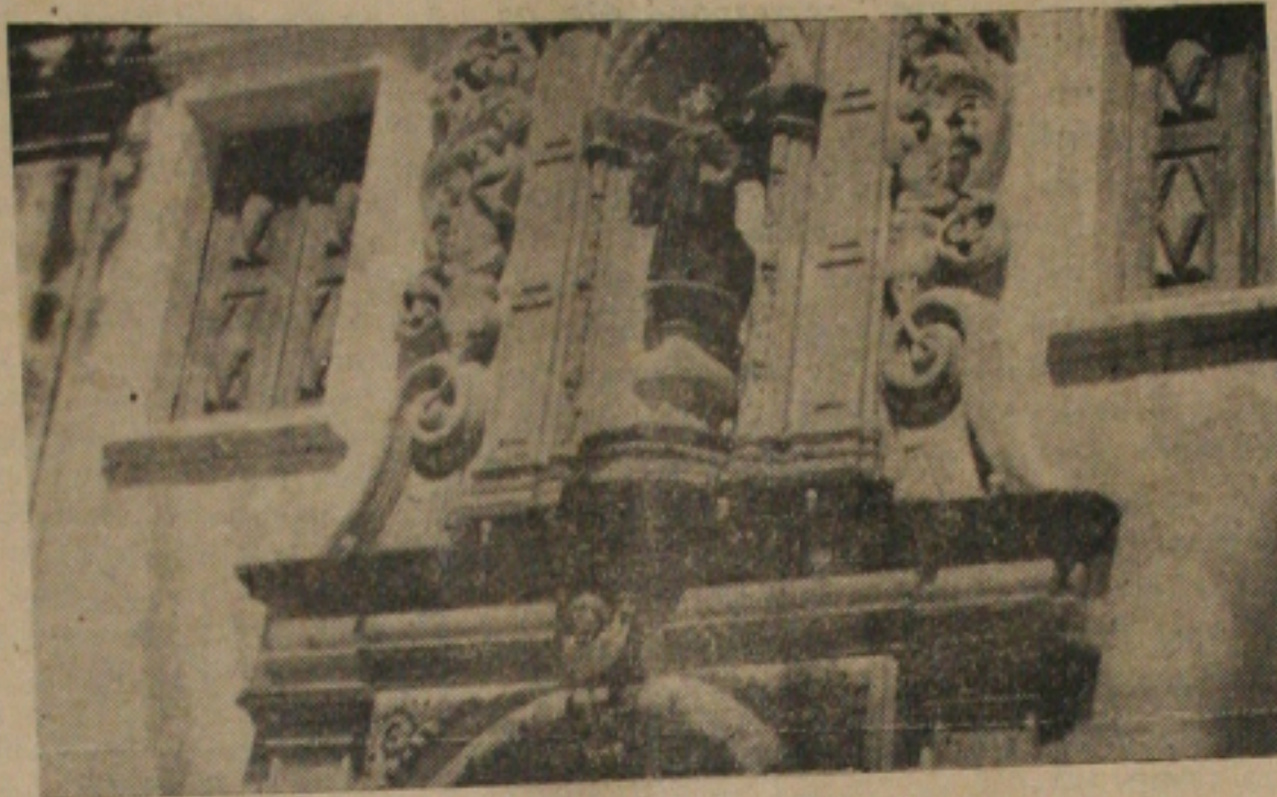
Magnífico detalhe da fachada da Matriz de Santo Amaro

Edifícios e objetos tombados no Patrimônio Histórico, estão a merecer uma fiscalização do órgão competente, de vez que a nossa reportagem constatou em Santo Amaro das Brotas, além de santos de madeira do século XVII, tangidos em um quarto do fundo da Igreja, sendo destruídos pelo cupim, como o mato nascendo na faixa da referida Igreja.