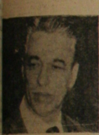
Premier Brochado da Rocha

BRASILIA, 13 — Enquanto uma comissão de deputados do PSD e PTB estuda os pontos que acompanharão a mensagem do primeiro-ministro Brochado da Rocha, a UDN ainda não tomou posição sobre o assunto e o PSP fechou questão, tornando posição contra o plebiscito.