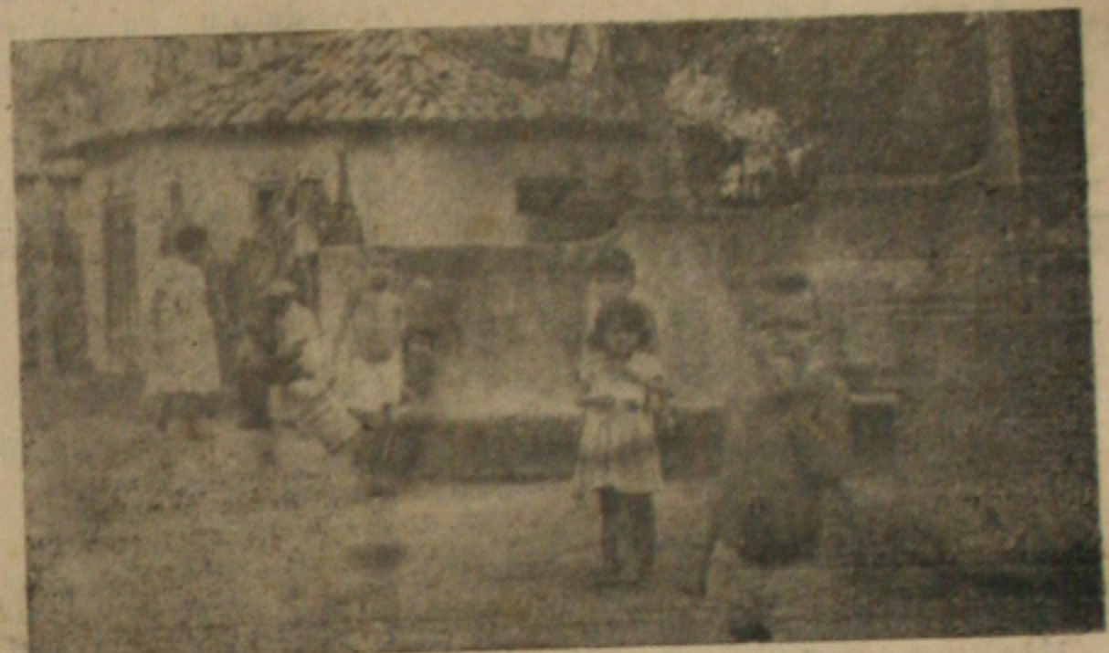
Fontes do "Manoel Preto", e a água o povo prefere em troca da do "Morro do Macaco"