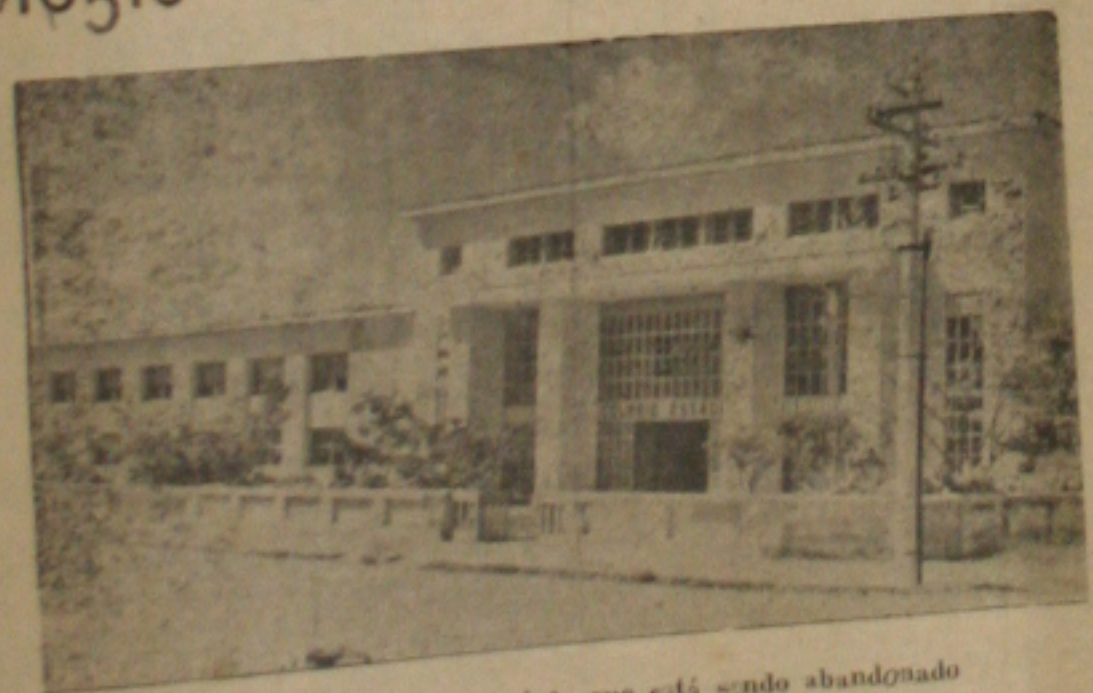
Colégio Estadual de Sergipe que está sendo abandonado

O moderno prédio do Colégio Estadual de Sergipe, relegado a completo abandono dos dois últimos governos, já começa a ser abandonado, com a transferência de algumas turmas para o antigo prédio do Ajenex Sergipense. Sob a alegação de que o referido prédio foi pesadamente construído, nas administrações dos senhores Leandro Maciel e Luiz Garcia, o mesmo não foi objeto de qualquer obra de restauração. Agora salas de aulas apresentam rachaduras enormes, obrigando a direção do estabelecimento a transferir para outro local, por medida de segurança, algumas turmas de alunos. Segundo estamos informados, espera-se o verão para o início das obras iniciais de restauração do Colégio Estadual de Sergipe, a fim de recuperá-lo para o funcionamento de todos os cursos.