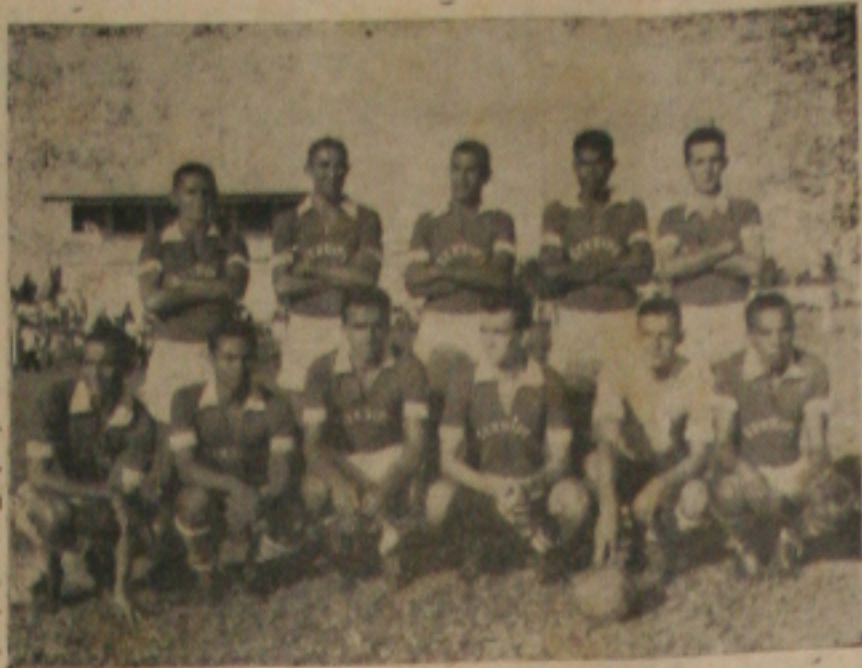
SERGIPE «ESTUDA» CRB — O quadro rubro que esta noite atuará frente ao CRB. Será um «ensaio» para a «Taça Brasil»

uma vez contra o seu adversário inicial da "Taça Brasil". Em sua temporada em Maceió, o clube rubro empatou com ele em Pajuçara em partida considerada sensacional pela crônica alagoana. Da peleja desta noite, com o não poderia deixar de ser, sairão as conclusões sobre as possibilidades dos litigantes em sua próxima disputa.