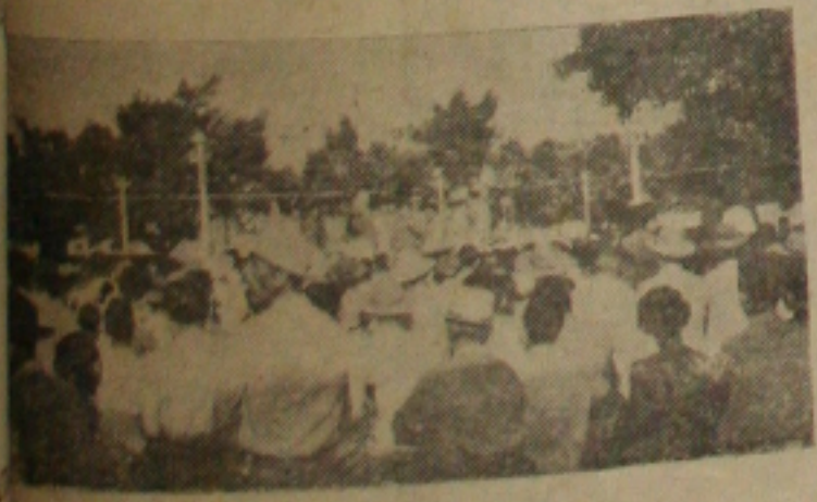
Aspecto do comício do Cedro