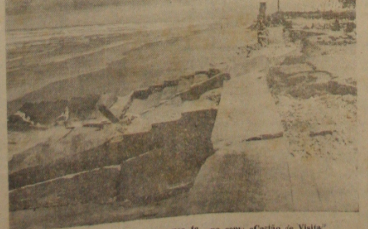
Isso funcionou por pouco tempo como "Cartão de Visita"

Técnicamente deve existir a maneira adequada para a construção de obra de tal natureza, que não foi, obviamente a aplicada no referido cais.