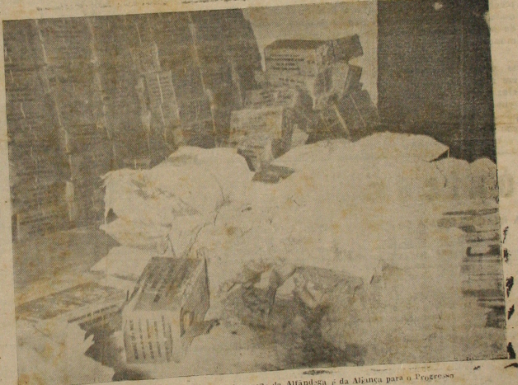
O leite que está apodrecendo nas Amazeas da Alfândega é da Aliança para o Progresso