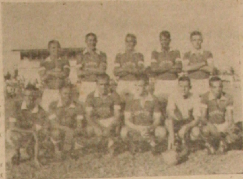
SOMENTE EM OUTUBRO — o quadro do Sergipe, que jogaria hoje contra o Confiança. O fará 3 de outubro.

Fala-se também, na possibilidade da realização do jogo na noite de amanhã, para isto colaborando os clubes preliantes. Colocam Sergipe e Confiança electricistas às suas expensas, a fim de que os trabalhos fossem concluídos a tempo. Tal medida, por ser anti-econômica, jamais poderia atender aos interesses dos clubes diretamente ligados ao assunto, a despeito da proposta ter partido do Confiança.