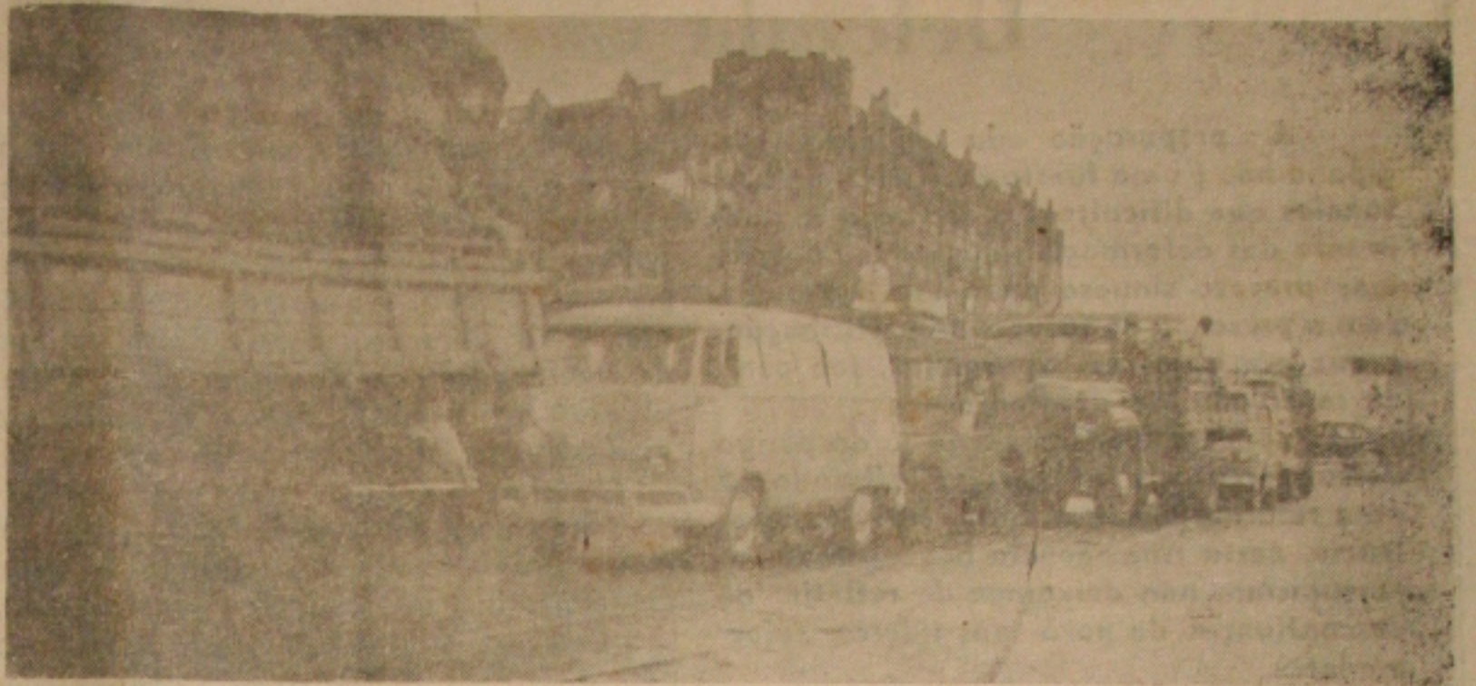
Fila interminável de veículos a caminho das bombas do "Posto Esso" para comprar gasolina mais cara