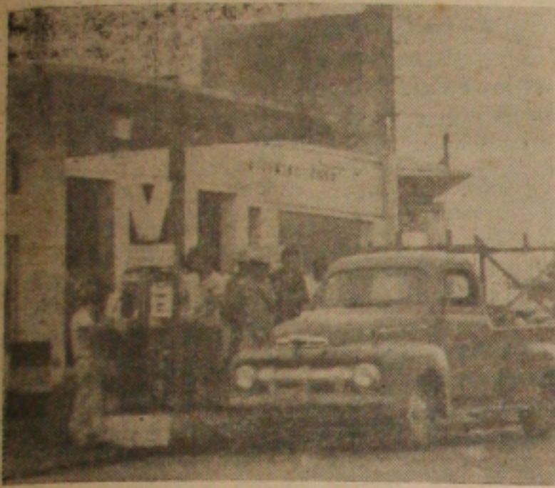
"Gasolina Azul" chegou a 35 cruzeiros o litro.

uma remessa da referida gasolina da ordem de oito mil litros.