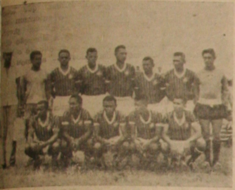
REABILITAÇÃO E PALAVRA DE ORDEM — O quadro do Paulistano, que logo mais à noite enfrentará ao Vasco em busca da reabilitação.

Em peleja que marcará o fim das atividades vascoianas no turno inicial do certame, Vasco e Paulistano estarão jogando esta noite no Estádio de Aracaju. Os dois preliantes, entram com oito e sete pontos perdidos, respectivamente, na tábua de classificações.