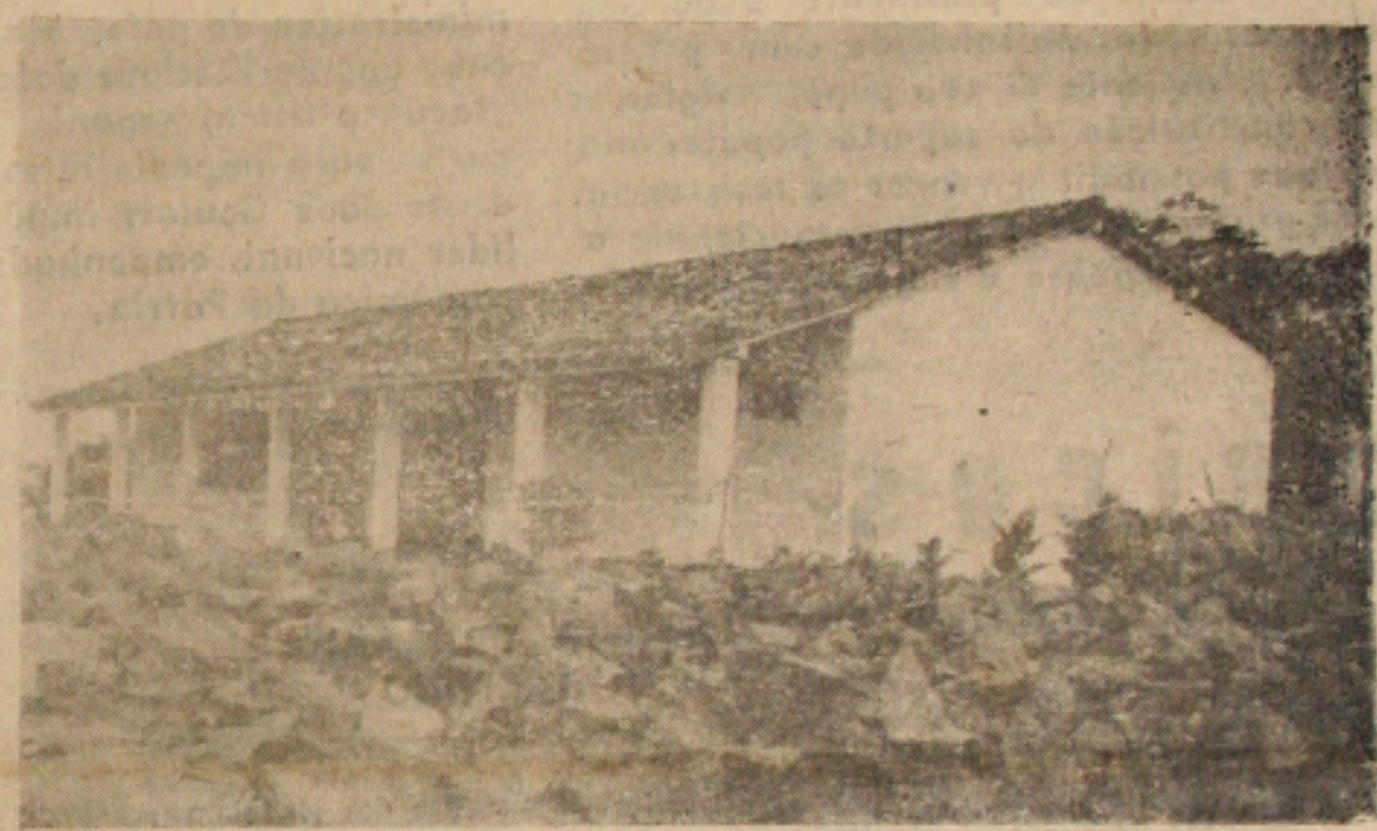
«Escola Rural» de Dispensa, uma das poucas que ainda estão funcionando.

Enquanto os governos não conservaram a maioria dos prédios construídos para Escolas Rurais há cerca de oito anos passados, vêm lutando por mais verbas do INEP para construir mais prédios, existindo alguns, novinhos em folha. Conclui na 6ª. página