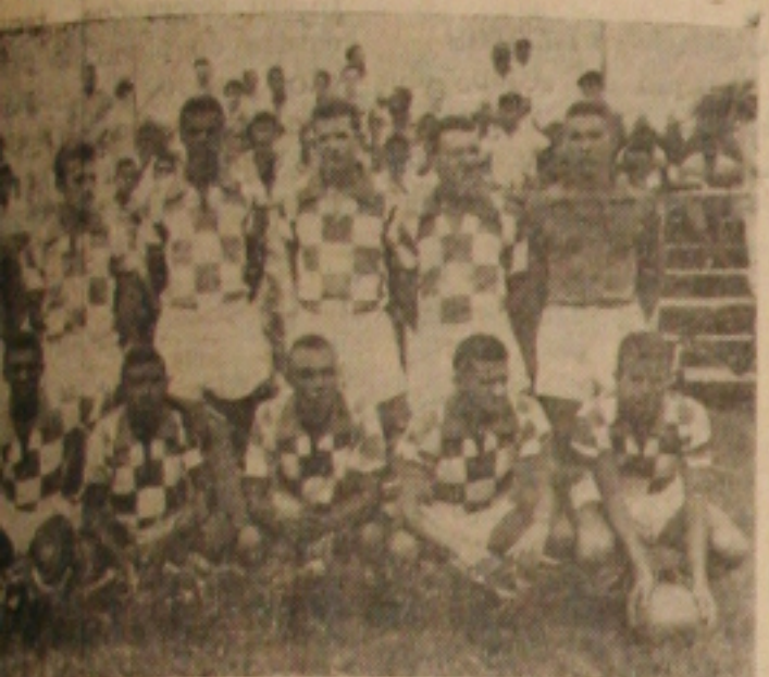
A DEMAIS — O quadro do Cotinguiba que preta tarde repetir a façanha realizada frente ao Paulistano.