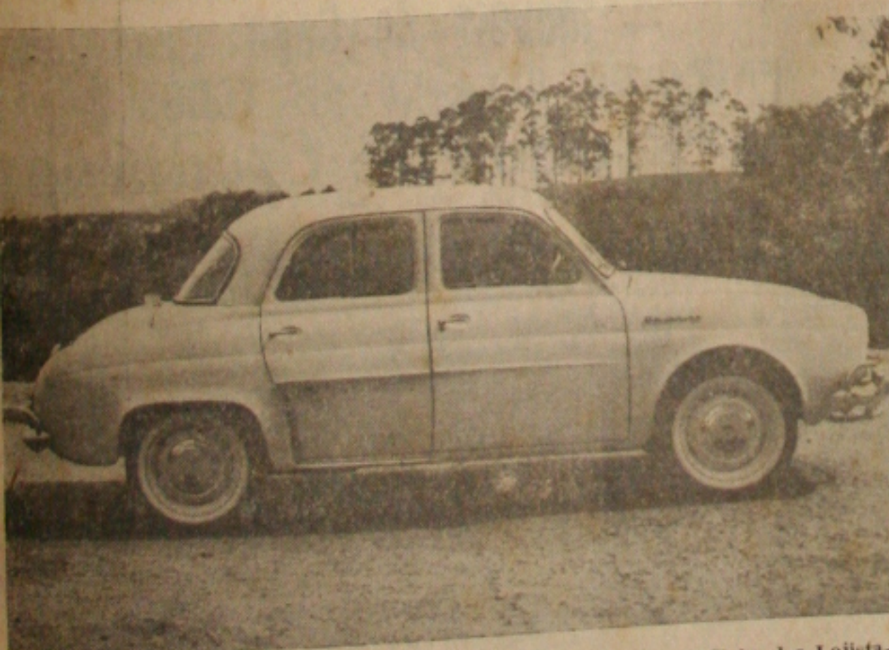
Este «Dauphine» zero quilometro poderá ser seu numa promoção do «Clube dos Lojistas»

PROMOÇÃO PUBLICITARIA DE UM MILHÃO E MEIO — COMPRAS DE TRÊS MIL CRUZEIROS DÃO DIREITO A CONCORRER Numa ampla campanha publicitária, o "Clube dos Diretores Lojistas" de Aracaju vai sortear no dia cinco de janeiro, um "Dauphine" entre os fregueses dos estabelecimentos filiados ao referido Clube. As pessoas que efetuarem compras nesses estabelecimentos, de três mil cruzeiros, totais ou parceladas, a partir de 13 de outubro próximo, participarão do sorteio do "Clube dos Diretores Lojistas".