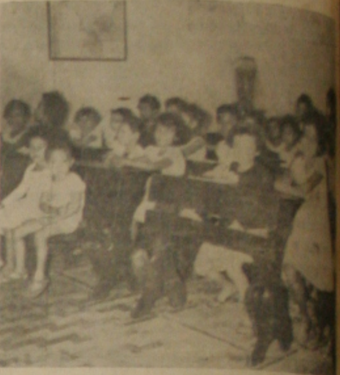
Aspecto da Escola

para o público em geral. Foram atendidas, na assistência aos velhos e crianças desamparadas, com cortes de tecidos, 287 pessoas.