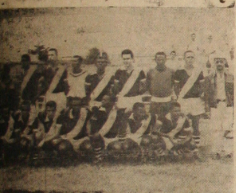
CONTINUA VENCENDO — A equipe vascaína que conseguiu frente ao Paulistano o seu 4º triunfo consecutivo. O 3º consecutivo.

Jôgo: COTINGUIBA 4 X PASSAGEM 0 — Local: Estádio de Aracaju (domingo a tarde) — Primeiro tempo: Cotinguiba 1x0 — Goleadores: Duda, Fernando, Quel e Carlos — Renda: Cr$ 13.220,00 — Juiz: Pedro Bonfim, auxiliado por Pedro Souza e Aloisio Santos — Preliminar: Cotinguiba 4 x Madureira 1 (juvenis) —