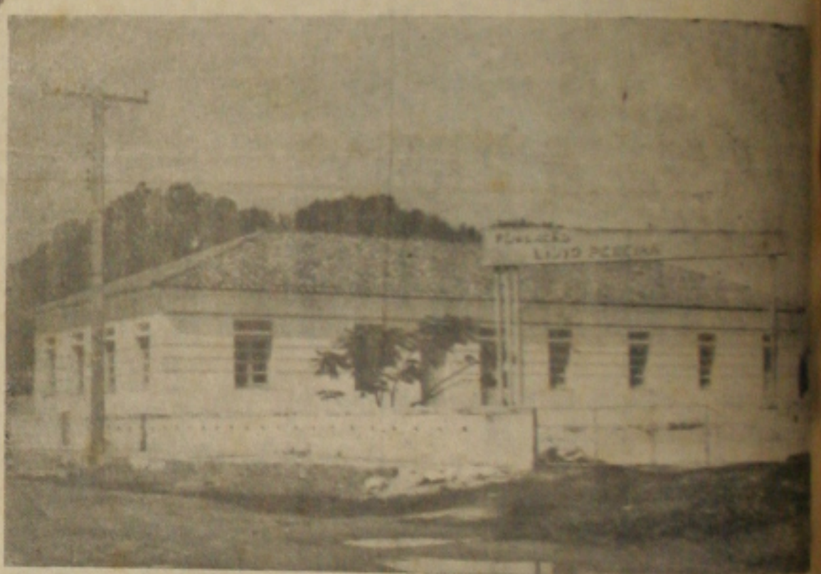
Fachada da Fundação Livio Pereira