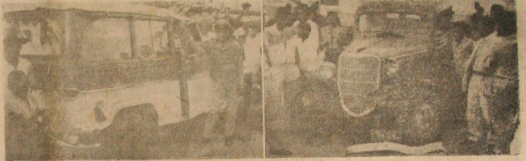
Detalhe do acidente na rua de Paraná

Trágico acidente ocorreu na tarde de ontem nesta Capital quando uma caminhoneta chocou-se com uma Rural Willys que se deslocava para a cidade de Propriá causando a morte de um funcionário estadual e ferindo várias pessoas.