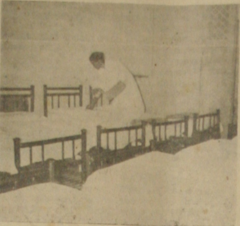
Albergue Noturno: solidariedade

Uma gigantesca obra de assistência social tem lugar em Aracaju, localizada no Bairro Siqueira Campos, proporcionando serviços e fazendo o bem sem alardes. É a FUNDAÇÃO LIVIO PEREIRA, instituição de caráter privado, que funciona em estreita colaboração com o Grupo Espirita Irmão Feogo, a que deve sua existência a própria fundação.