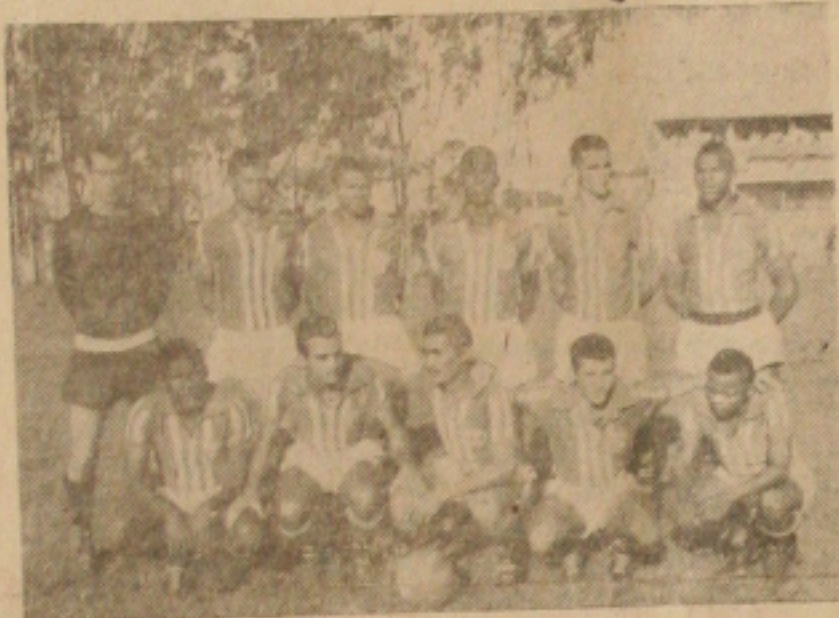
RETORNARA HOJE — O quadro do Confiança que depois de quase um mês sem atuar, voltará a atividade frente o Sergipe.