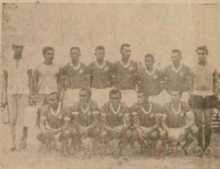
SERÁ VISTO AMANHÃ — A equipe de Paulistano, cujo integrante serão observados na tarde de amanhã pelo técnico da seleção sergipana