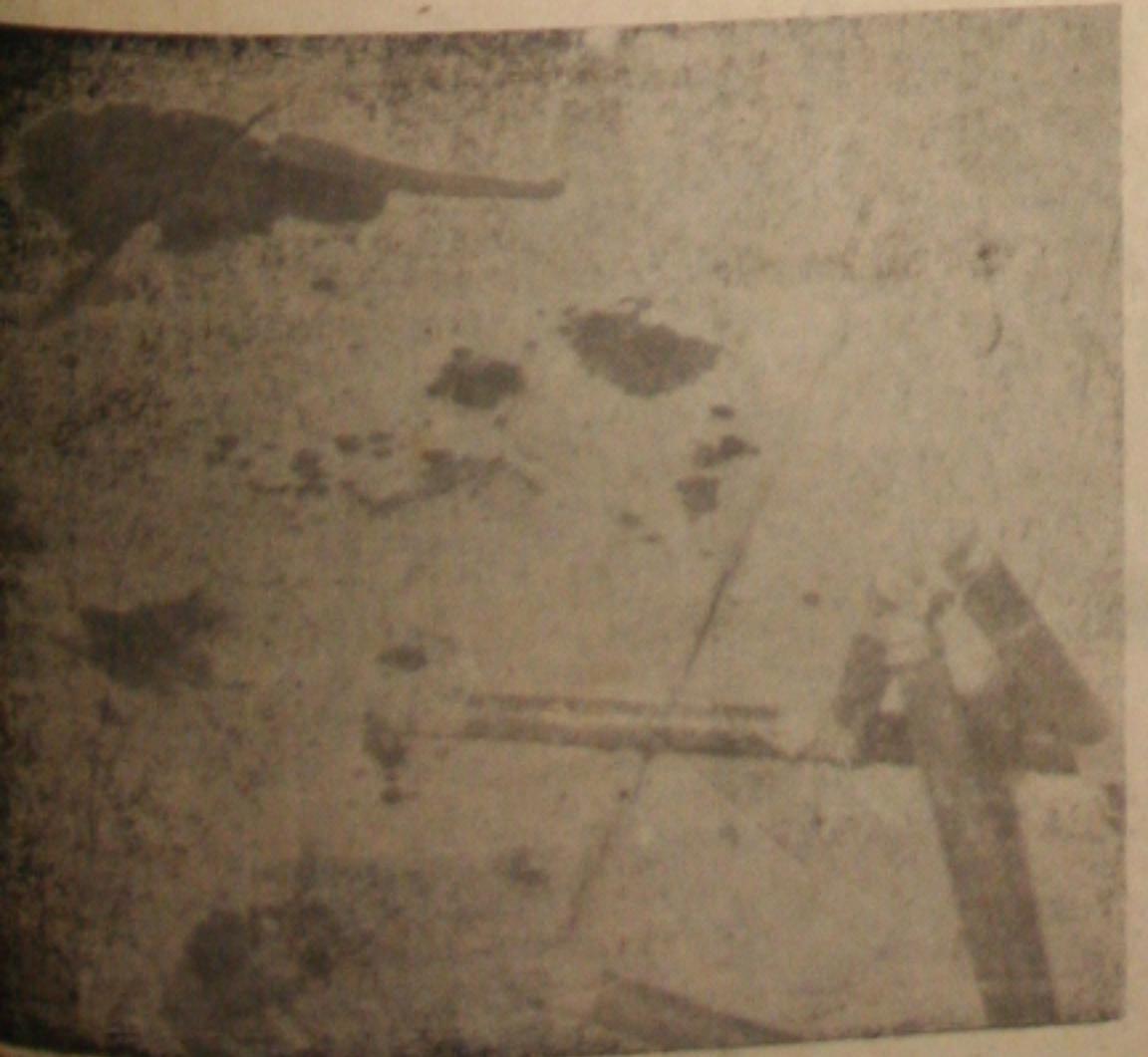
Conclue na 6ª. página

viz a Municipal — Agência de Notícias — dirigida telegraficamente procedente desta Capital, segundo o qual o criminoso foi preso em Itabaiana. Em Capela, uma verdadeira cortina de silêncio cobre o crime e paralisado de Solano Dórea, acreditando-se porém que elementos impor-