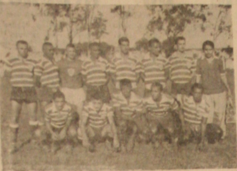
DESCERA A SERRA — A equipe da Associação Olímpica de Itabaiana, que esta tarde dará combate ao Paulistano no Estádio Sabino Ribeiro.