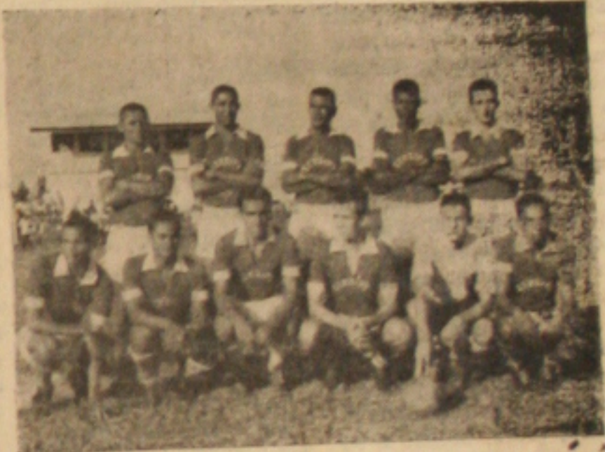
DARÁ MAIS — A equipe do Sergipe que deverá ceder maior número de jogadores aos treinamentos da seleção.

PARA A COMPRA DE AÇÕES DA VEMAG, CONSULTE A COFIBRÁS S.A. CRÉDITO, FINANCIAMENTO E INVESTIMENTOS Sede: Pça. Antonio Prado, 33 - 5.º andar - Telefones: 37-7179 e 37-7170 Loja de Vendas: Rua Augusta, 2143 - São Paulo