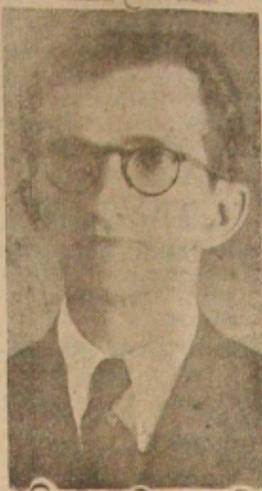
A vitória do candidato Seixas Dória foi resultante de vários fatores que podemos enumerar: 1.º — o desejo

irreprimível, que o povo sergipano manifestou às claras de voltar a um Governo que restabelesse em Sergipe um clima de paz e tranquilidade para todos, sem distinção de cor partidária; 2.º — A união das forças democráticas que compuseram o esquema Seixas Dória; 3.º — A confiança que o candidato inspirou ao povo sergipano."