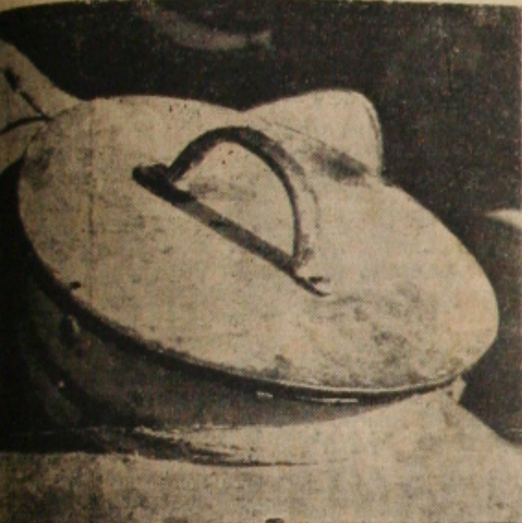
Os depósitos para a distribuição do leite são selados

Cooperativa poderá vender mais leite do que o recebido. Conclui na 8a. página