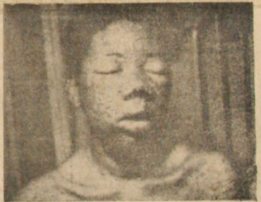
Portador de Variola benigna

Em Sergipe a variola não mata, porém deforma as vítimas, não só pelas suas cicatrizes antiestéticas, como pior do que isso, existência de variola em Aracaju. Daí a importância da Campanha de Erradicação agora levada a efeito pelos órgãos de Saúde Pública", declarou ontem à nossa reportagem um porta-voz autorizado da Campanha de Erradicação da Variola em Aracaju.