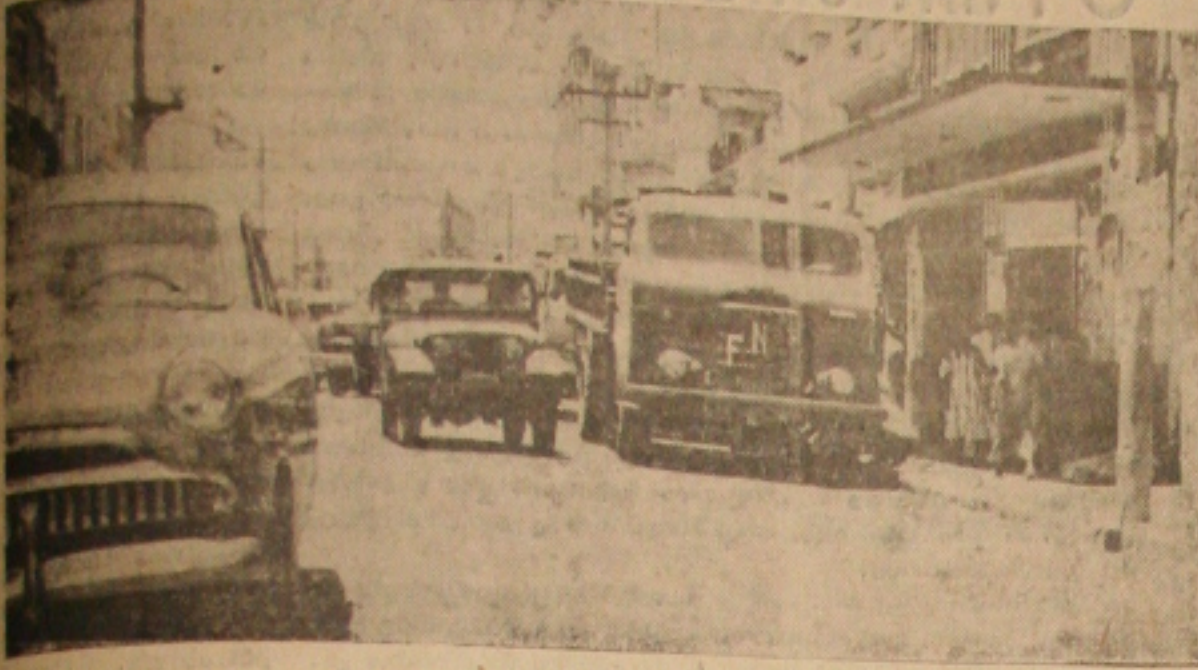
Veículos de todas as naturezas estacionados na 'Joaquim Prado Franco'

Todo o trabalho de um técnico da Guanabara que passou alguns dias nesta Capital elaborando um plano para o trânsito de Aracaju foi-se de águas abaixo por falta de execução das nossas autoridades do trânsito, despreocupadas completamente do problema.