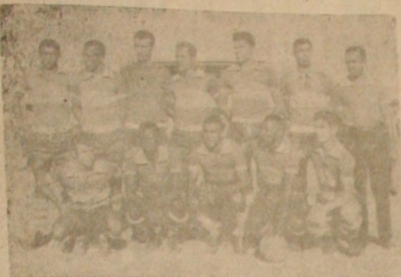
EM AÇÃO PRÁ VALER — A equipe sergipana que com algumas modificações estreará no certame brasileiro de futebol