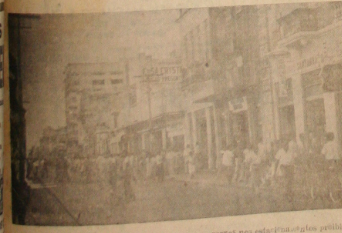
Na João Pessoa ontem sem engarrafamentos e sem carros nos estacionamentos proibidos