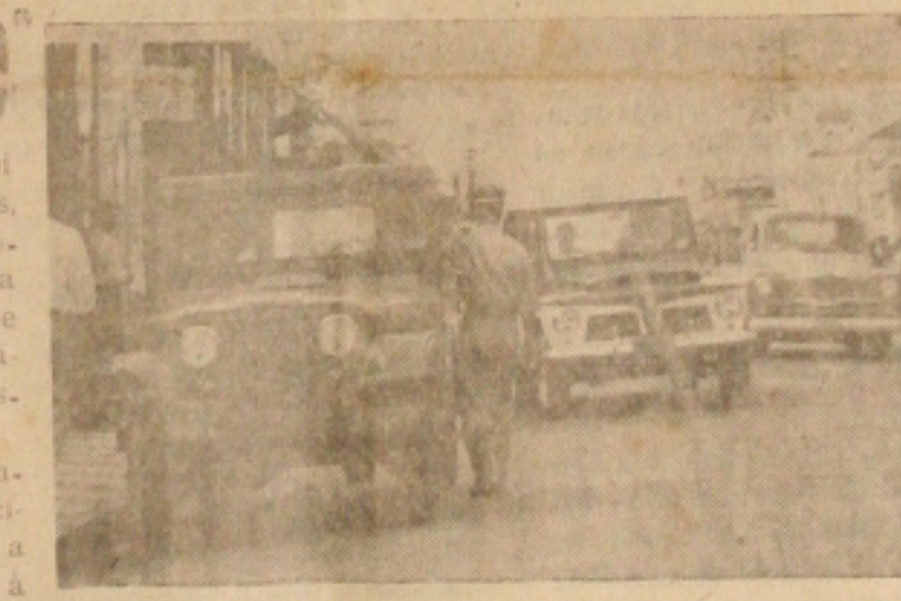
Inspetor de trânsito chamando o recalcitrante para retirar o carro do estacionamento proibido

Pelo menos, ontem tudo foi feito sem anormalidades, com os motoristas demonstrando compreensão para os apêlos dos Inspetores e Guardas Civis, para retirarem os seus carros dos estacionamentos proibidos. Somente isoladamente, a pareceu um outro recalcitrante, que logo passou a cumprir os regulamentos, à proporção que observava que também o povo estava aplaudindo a providência.