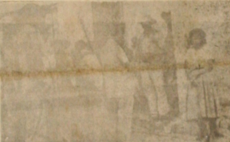
Posseiros falgando à nossa reportagem

que é uma história a parte desse negócio da Colônia “Governador Arnaldo Garcia”, diz que somente sairá dali para o cemitério.