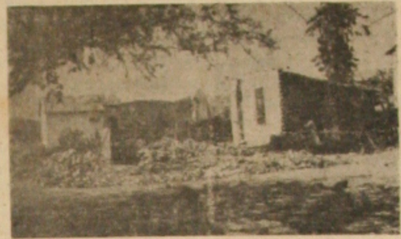
Aspecto da devastação indenista

Explicitamente até agora nenhum dos posseiros tem título de propriedade dos lotes de terras e das casas da Colônia. O que verificamos realmente é que o negócio é arrumado na exploração do clientelismo eleitoral, pois com a mu-