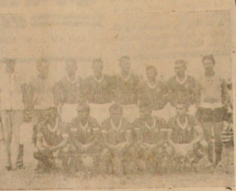
TENTARÁ REABILITAÇÃO — A equipe tricolor que esta noite lutará por um bom resultado frente ao Confiança