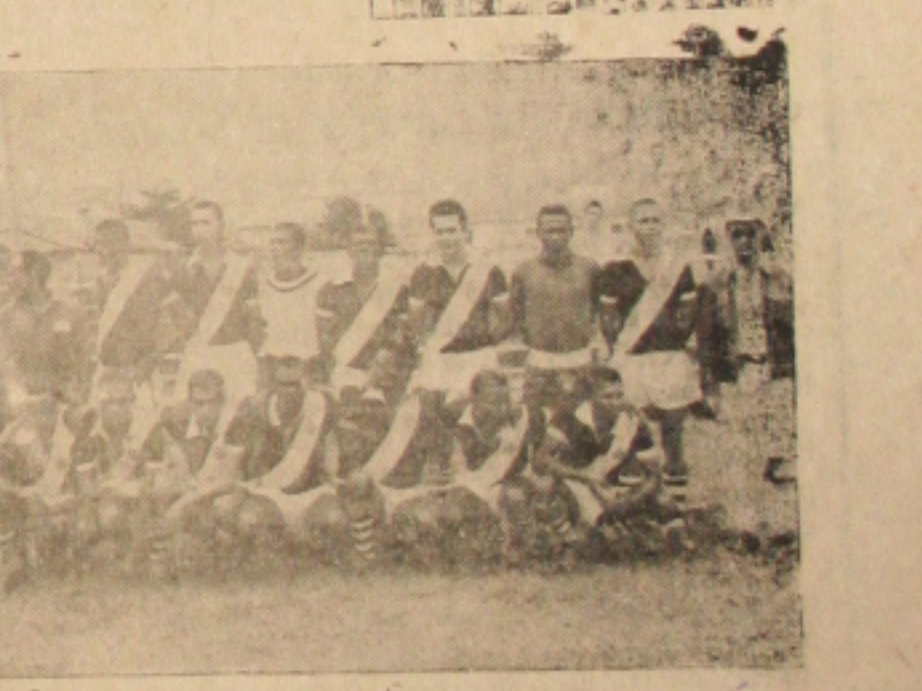
SUBIRA A SERRA - A equipe do Vasco que domingo enfrentará ao Itabaiana em disputa do certame misto-profissional.