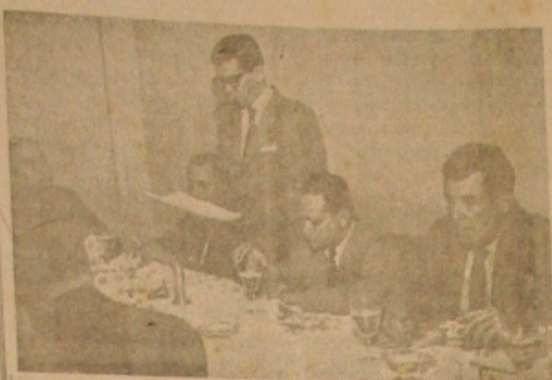
O presidente da CNI, definindo a posição da indústria sobre nacionalismo