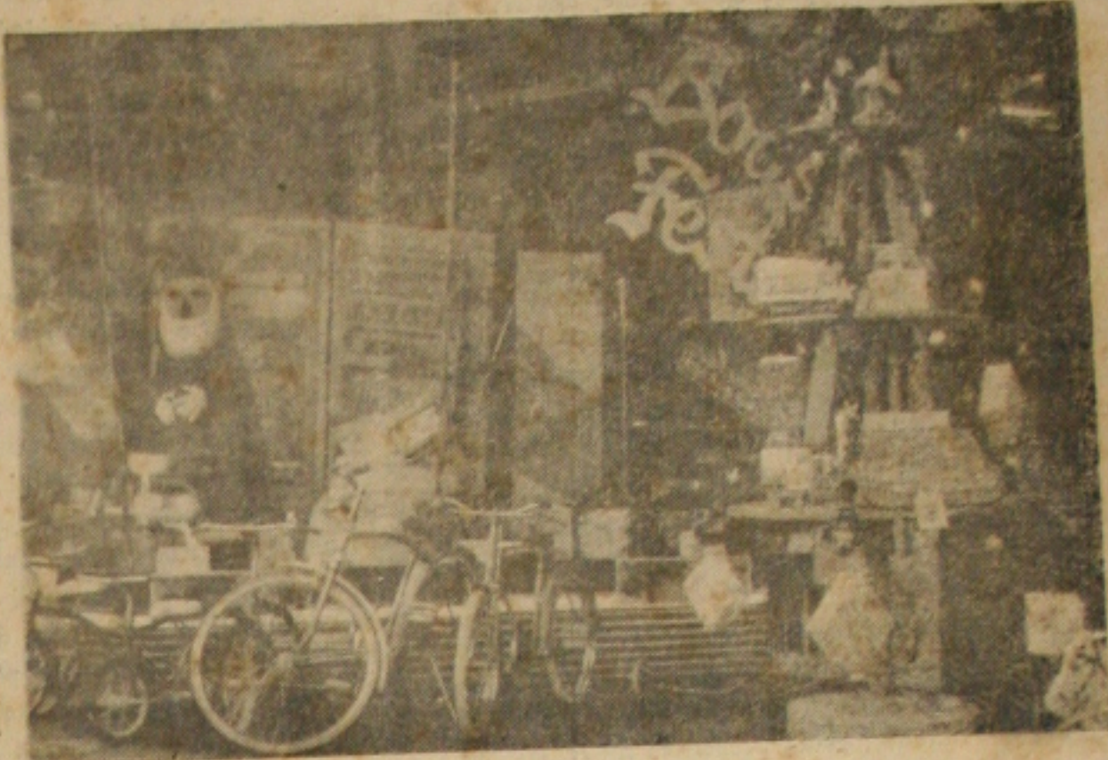
Uma das poucas vitrines para o Natal no comércio da 'João Pessoa'