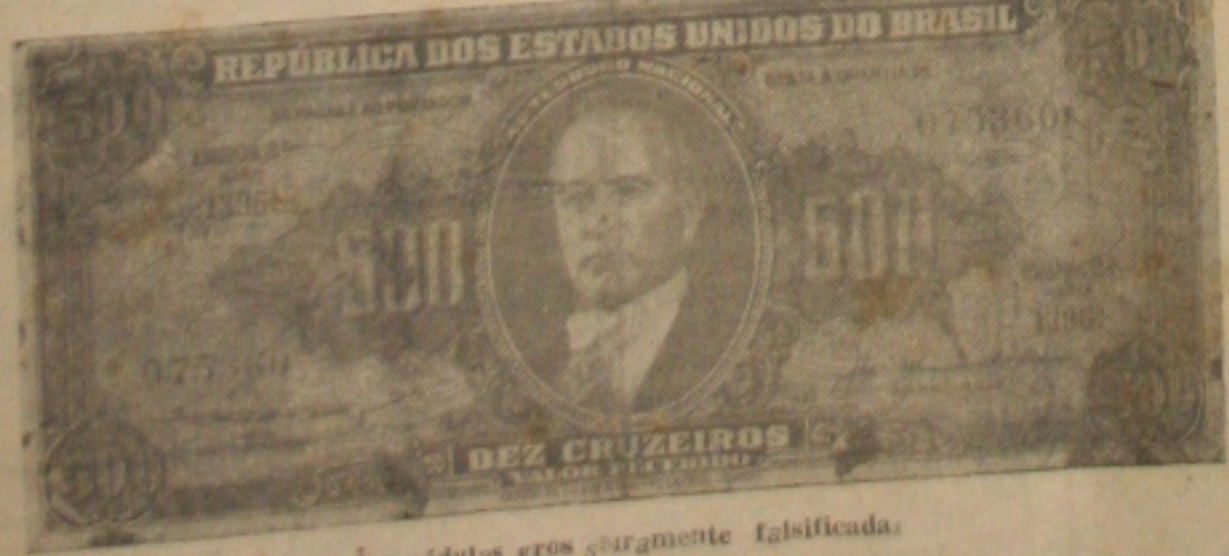
Uma das cédulas grossamente falsificadas.