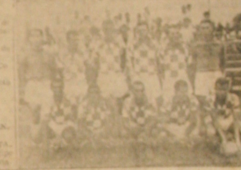
VAI A PASSAGEM — O célebre jogador de Cotinguiba, que esta tarde dará combate a Passagem no campo de futebol.

PROPRIA X CENTRAL NAO FOI CONFIRMADO Aracaju, 18 de dezembro de 1962. J. C. BARRETTO S/A — COM. E IND. Aracaju, 18 de dezembro de 1962.