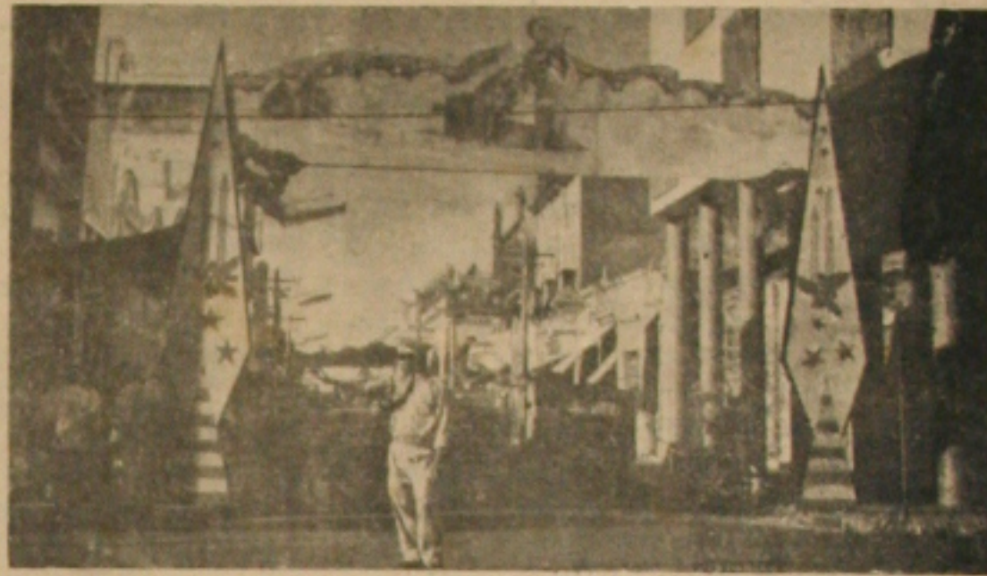
Rua João Pessoa toma novo aspecto com ornamentação para o Natal

Como nos anos anteriores, o Clube dos Lojistas contou com a colaboração do Estado e da Prefeitura da Capital, para levar a efeito a referida ornamentação. O Estado contribuiu com uma parcela em dinheiro, enquanto que a Prefeitura ficou responsável pela parte de iluminação do referido logradouro.