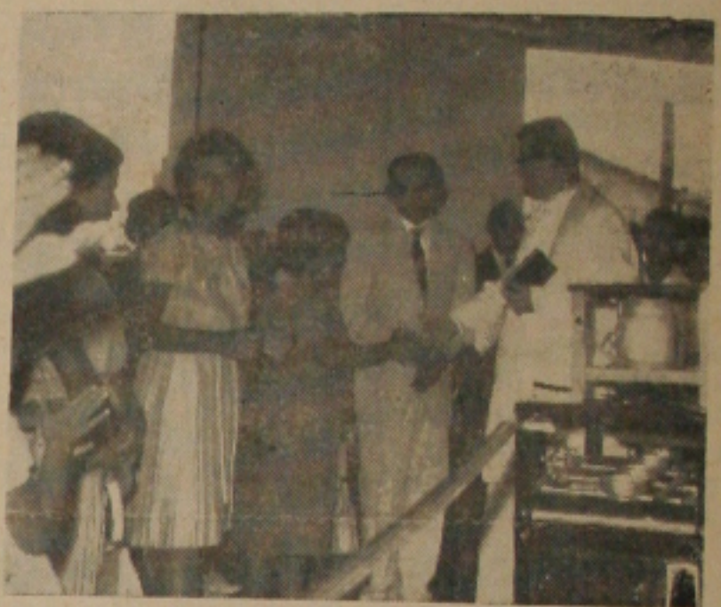
Aspecto da inauguração vendo-se o seu proprietário em 1.º plano

Objetivando melhor servir à população sergipana, a firma CLAUDIONOR SANTOS & FILHOS, fez inaugurar domingo passado, no andar terreo do Edifício Santana, à Rua de Itabaianinha, a casa comercial denominada «A GRACIOSA». «A GRACIOSA» é mais uma das bem montadas lojas que servirá ao povo de nossa barbosopolis, e que se encontra localizada no coração do nosso comércio.